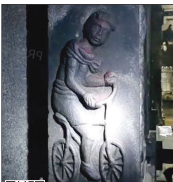
تحت الدراجة كما ظهر في المعبد

إن نحت الدراجة الموجودة في هذا المعبد القديم الذي يعود في تاريخه إلى نحو 2000 سنة خلت؟