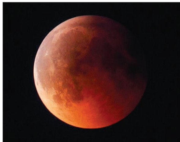
مراحل الخسوف المختلفة تستغرق 6 ساعات و13 دقيقة