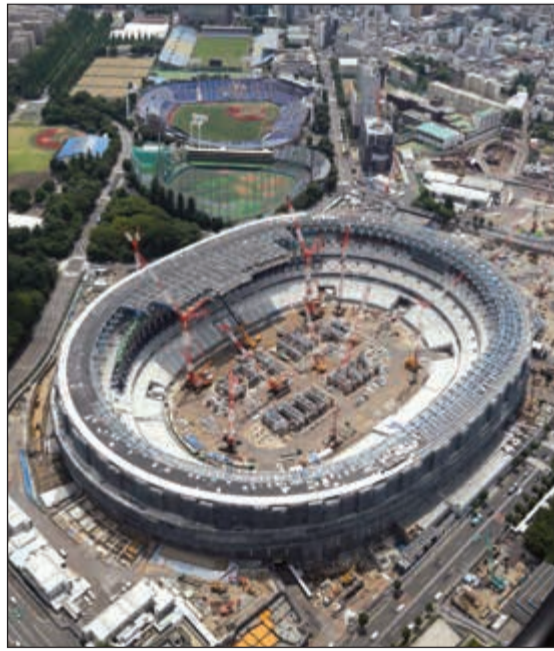
الأعمال مستمرة في ستاد اليابان الوطني