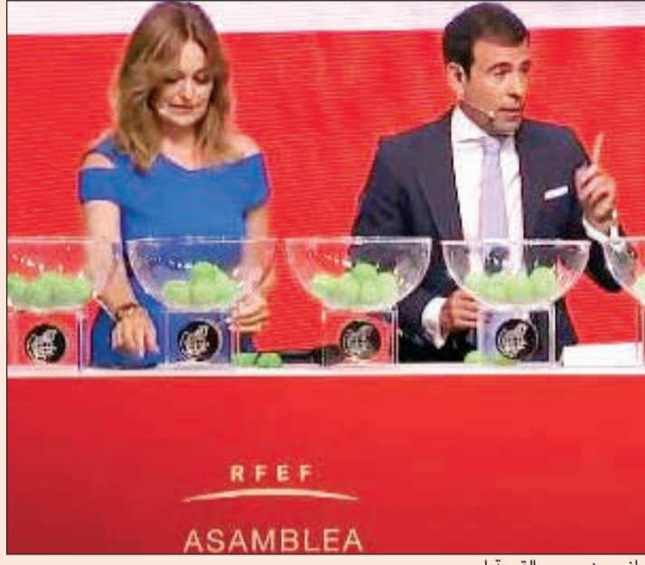
جانب من سحب القرعة أمس

الاسبان التي رأسها بين 2010 و2017، واقترح تسديد جزء من دينه الشخصي من أموال النقابة المخصصة للمشروع. وأكدت محاكم منطقة فالنسيا في اتصال مع وكالة فرانس برس تقديم الشكوى رافضة الإفصاح عن فتح تحقيق تمهيداً. بدورها، أكدت نقابة اللاعبين في بيان «عدم تمويل أعمال شخصية لروبياليس» وأن المعلومات المذكورة في الصحافة «مغلوبة تماماً». وأوضحت النقابة أنها سعت للحصول على خدمات شركة معمارية في المرحلة الأولى من المشروع. وتابعت: «دفعت النقابة فاتورة للعمل المطلوب، ونظرا لعدم تنفيذها بالشروط المتفق عليها، طلبت بإلغاء العقد في المحكمة واستعادة هذا المبلغ من الشركة المعمارية». وانتخب روبياليس في مايو 2018 بعد اقالة الرئيس السابق أنخل ماريا فيار الضالع في فضيحة فساد.