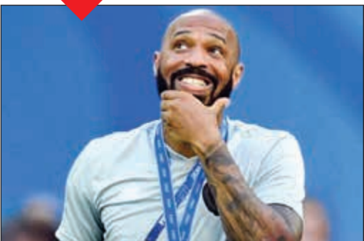
تيري هنري يبحث عن تجربة جديدة

وافق النجم الفرنسي السابق تيري هنري على تدريب نادي استون فيلا المشارك في دوري الدرجة الإنجليزية الثانية (تشامبيون شيب)، بحسب ما ذكرت صحيفة «ديلي ستار» البريطانية أمس. وأشارت الصحيفة إلى أن الملياردير المصري ناصف ساويرس ورجل الأعمال الأمريكي ويس اندس (أحد مالكي فرقي ميلووكي باكس ضمن دوري NBA لكرة السلة) اللذين اشترتا حصة كبيرة في النادي، ليسا مقتنعين بقدرة المدرب الحالي ستيف بروس على إعادة «الفيلانز» إلى دوري النخبة (بريميرليغ).