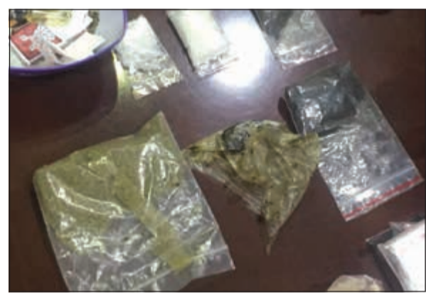
كوكيتيل مخدرات عثر عليه رجال مباحث السلاح بحوزة المتهم

وقال مصدر أمني: تم التنسيق مع النيابة العامة لاستصدار إذن بضبط المتهم وفتيش محل إقامته وهو جاحور يقع في المنطقة الشمالية للبلاد وانتقلت قوة وأوقفت المتهم وبتفتيش محل إقامته تم العثور على مواد مخدرة متنوعة عبارة عن هيروين وحشيش وماريغوانا وكوكايين إلى جانب ميزان حساس، وتبين ان المركبة التي عثر عليها بحوزة المتهم مبلغ عن سرقته خلال توقفها مقابل إحدى الصيدليات، واعترف المتهم أمام العقيد الشهاب بالالتجار في المخدرات وسرقة المركبة التي تركها صاحبها في وضعية تشغيل.