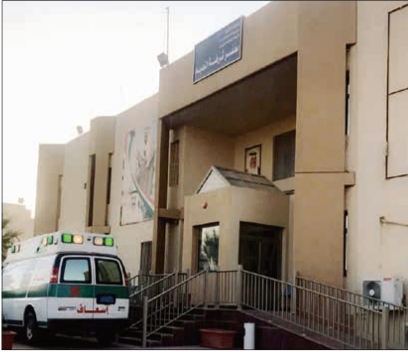
سيارة الإسعاف امام مبنى مخفر شرطة النعيم

فنيين من الطوارئ الطبية ابلاغاً عمليات الداخلية بأنهما كانا ينقلان حالة مرضية وتركوا سيارة الإسعاف المرتبطة بالأقمار الاصطناعية متوقفة في مدخل الطوارئ وكان بداخلها المفتاح ولم يجدها. وأضاف المصدر: بعد دقائق تم إبلاغ العمليات بأن السيارة المبلغ عن فقدانها موجودة في مخفر النعيم وأن الشخص الذي قام بسرقتها مواطن من مواليد 1967، حيث قال المواطن انه علم بوجود ابنه في مستشفى الجهراء ولدى توجهه شاهد ابنه يصطحبه رجال الأمن داخل دورية فصعد إلى سيارة الإسعاف وقام بتعقبها إلى حيث توقفا في مخفر النعيم.