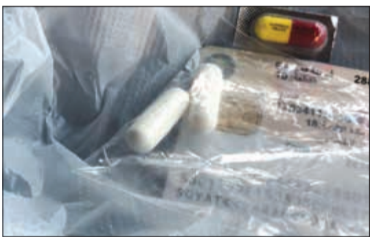
الحبوب التي تركتها الفلبينية في التاكسي

وجه مدير عام دوريات النجدة اللواء عبدالعزيز الهاجري بإحالة وافدة فلبينية إلى الإدارة العامة لمكافحة المخدرات للوقوف على مصدرها في الحصول على الحبوب المخدرة، التي تم العثور عليها بحوزتها. واستنادا إلى مصدر أمني فإن إحدى دوريات نجدة حولي اشتبهت في وافدة فلبينية كانت تستقل تاكسي جوالاً في حولي، حيث لاحظ رجال النجدة ارتياكاً ملحوظاً بمجرد توقفها، ولدى الاستعلام عنها تبين انها متغيبه.