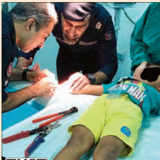
رجال الإطفاء يتعاملون مع إصبع الطفل