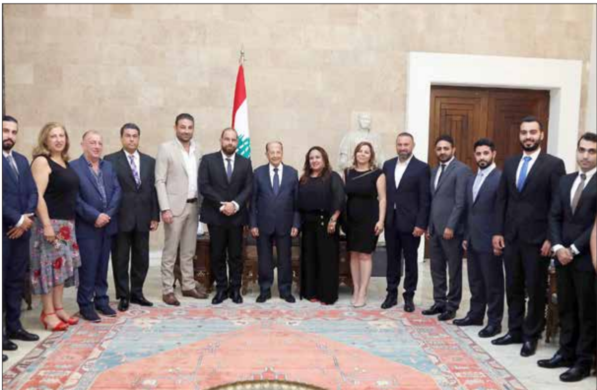
الرئيس العماد ميشال عون مستقبلياً في بعبدا وفداً اغترباً من كتدا (محمود الطويل)

يقول قوله، الرهان على صيرورة إعادة النازحين مهمة أميركية - روسية، منذ قمة هلسنكي، ومن دون التنسيق السياسي المجرى أو المباشر مع النظام السوري، الذي لم يبرح دور الخلق على مسرح أزمة بلده. وأوضح شعبان ما يشي بأن رئيس الحكومة أصبح على بينة من الخطة الروسية - الأميركية المشتركة، التي تلحظ إعادة نحو مليوني لاجئ سوري من لبنان والأردن، وأن لجنة أميركية - روسية - أردنية تشكلت لهذه الغاية، وثمة مسعى روسي للتجديد بتشكيل لجنة أميركية - روسية - لبنانية مماثلة. هذه الخطوات الأساسية أقيمت صحة طرح الذين اعتبروا أن حل مشكلة اللاجئين السوريين لا يتم من خلال إعلانهم، بل عبر مظلة دولية، تطمن العائدين إلى أن حواجز القانون السوري رقم 10، لن تكون بانتظارهم، وأن الضمانة الروسية - الدولية كافية لحماية عودتهم وحقوقهم.