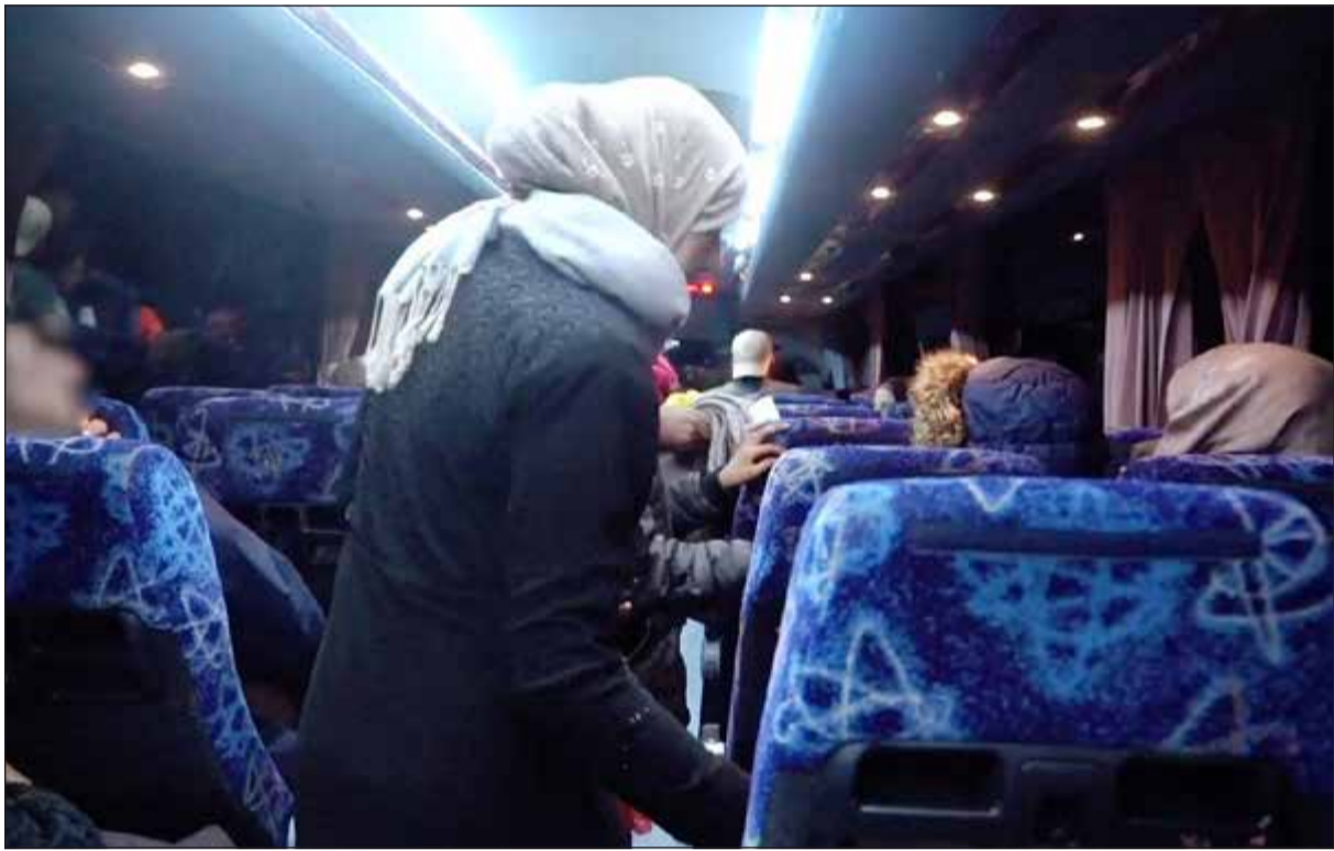
صورة وزعها الجيش الإسرائيلي لعملية إجلاء «الخود البيضاء» وعائلاتهم

ويعتبر «حزب الاتحاد الديمقراطي» (pyd) أحد الأحزاب المنضوية في «حركة المجتمع الديمقراطي» وهو الوجهة السياسية ل«وحدات حماية الشعب» التي تسيطر على قسد وطردتها عملية مشتركة لتركيا والجيش الحر من عفرين ومنج. واعتبر خليل أن «التوتر القادم في إدلب سيكون عاملا مساعدا ومهما من أجل الحد من الدور التركي في سورية». وتوقع «التصادم أو تطور الخلافات بين روسيا وتركيا، حيث لن تتخلى تركيا عن تلك الضمانات وهذا ما سيعرضها للمواجهة مع روسيا، أو ستكون تركيا أمام موقف عدم الالتزام بالعهود التي منحها لروسيا في القضايا المتفق عليها». وفي الجنوب السوري، فعل الجيش الإسرائيلي أحدث أنظمة الدفاع الجوي لديه لأول مرة على الحدود مع سورية أمس، حيث تقدمت قوات النظام المدعومة من روسيا على حساب المعارضة بينما أرسلت روسيا مبعوثين لإجراء محادثات وصفتها بأنها «عاجلة» مع رئيس الوزراء الإسرائيلي بنيامين نتانياهو. وفي مؤشر على التوترات المتزايدة، أطلقت إسرائيل صاروخين من نظام مقلع داود على صاروخين قال الجيش الإسرائيلي لاحقا إنهما سقطا داخل الأراضي السورية وأطلقا في إطار المعارك التي تدور فيها. وهذه أول مرة تعلن فيها إسرائيل عن استخدام النظام الذري صرحي متوسط المدى الذي صنع بالتعاون مع شركة ريثيون الأميركية في العمليات. وأدت الواقعة لإطلاق صفارات الإنذار في شمال إسرائيل وعلى هضبة الجولان مما دفع كثيرين من السكان للجوء إلى الخبايا،