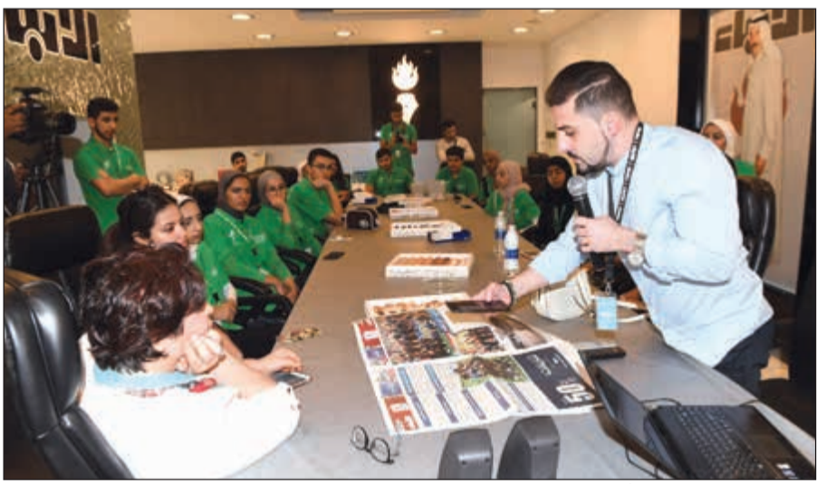
تجربة «الواقع المعزز» على أحد الأخبار المنشورة في «الأنباء»