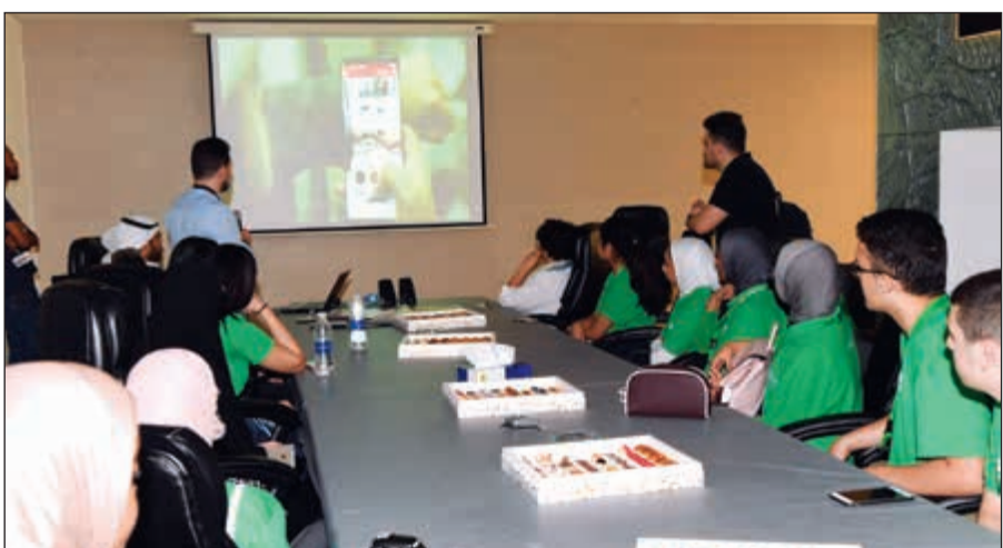
«الأنباء» عرضت فيلماً تعريفياً عن تاريخها الحافل ومواكبها للتطور التقني والتكنولوجي في صناعة الخبر

إلى توزيعها على الأسواق والمشاركين. وفي الختام تم التقاط الصور التذكارية للمشاركين من طلبة «لويك» بهذه الجولة التعريفية في