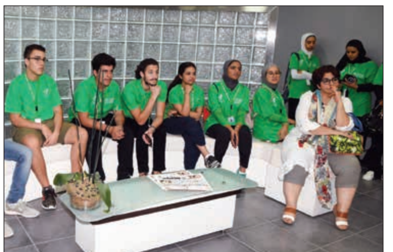
انتباه وتركيز من الطلبة خلال الجولة