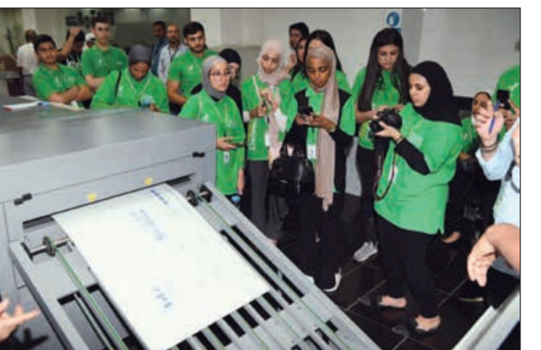
متابعة عملية إنتاج الصفحات تمهيداً لطباعتها