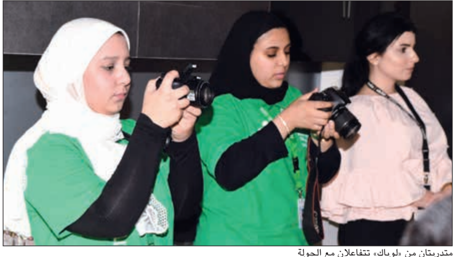
متردبتان من «لويك» تتفانغان مع الجولة