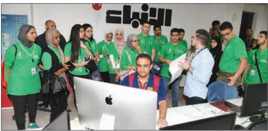
شرح لآلية تنفيذ الصفحات في قسم الكمبيوتر