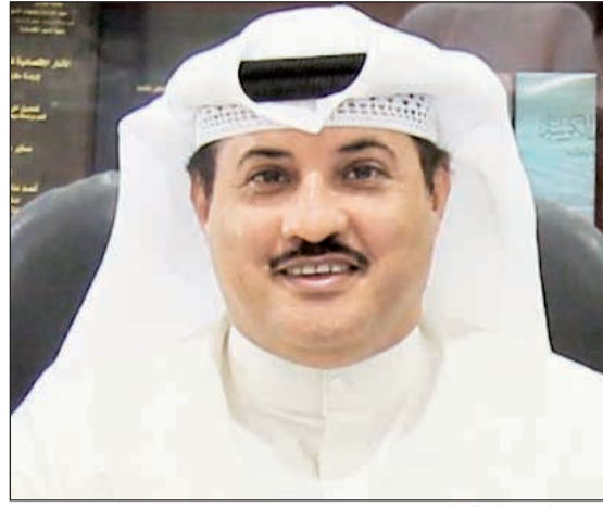
المستشار جمال الجلاوي

د.نايف الجحرف. يشار إلى ان الإحصائية الخاصة بعمل جمارك الشويخ أظهرت ان المتوسط اليومي للحاويات خلال الأشهر الـ 6 الأولى بلغ 694,8 تقريباً، حيث بلغت في يناير حاوية وبلغت شهر مايو فيما بلغ المتوسط اليومي في الشهر الأخير من النصف الأول للعام الحالي ما يقارب 832 حاوية.