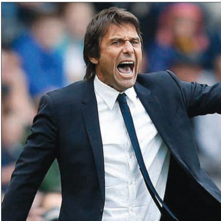
انتونيو كونتي يريد حقوقه من ادارة تشلسي