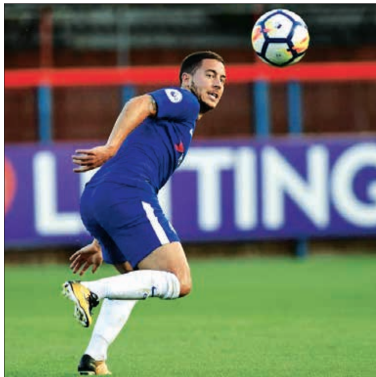
هازارد يقترب من ريال مدريد