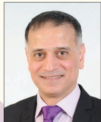
إعداد: د. طارق البكري