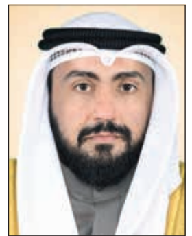
الشيخ د. باسل الصباح