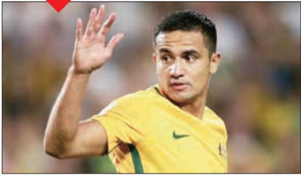
تيم كاهيل ترك بصمة كبيرة في تاريخ المنتخب الأسترالي

أعلن نجم الهجوم الأسترالي تيم كاهيل أمس اعتزال اللعب الدولي بعد مسيرة استمرت طوال 14 عاما مع المنتخب الأسترالي لكرة القدم. وذكر كاهيل أمس عبر حسابه بموقع شبكة التواصل الاجتماعي «تويتر»: «أعلن رسميا إنهاء مسيرتي الدولية مع منتخب أستراليا». وأضاف «لا توجد كلمات يمكن أن تصف معنى تمثيلي لي، أقدم بشكر هائل لكل من دعمني طوال كل الأعوام التي ارتديت فيها قميص المنتخب الأسترالي». ويعد كاهيل (38 عاما) من أبرز نجوم الرياضة الأسترالية بشكل عام، وقد سجل للمنتخب عددا من أروع وأهم الأهداف للفريق. وسجل كاهيل أهداف حاسمة للمنتخب في العديد من المناسبات، منها المباراة أمام المنتخب السوري في آياب الملحق الفاصل بتصفيات كأس العالم في العام الماضي، حيث سجل ثنائية ليحول المنتخب الأسترالي تأخره بهدف إلى الفوز 2-1. ويتخزع بطاقة التأهل لمونديال روسيا 2018.