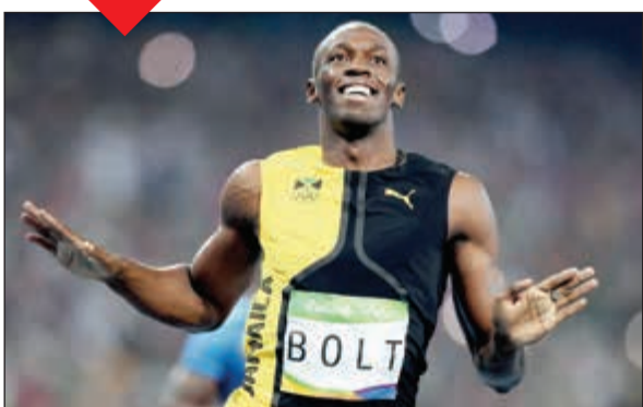
أوساين بولت من عشاق الكرة

أعلن أحد وكلاء اللاعبين أمس أن العداء الجامايكي يوسين بولت بات قريبا من الانضمام إلى فريق منافس بالدوري الأسترالي لكرة القدم. وقال وكيل لاعبي كرة القدم توني راليس إن بولت المتوج بـ 8 ميداليات ذهبية أولمبية في سباقات العدو والذي اعتزل منافسات المضمار في العام الماضي، توصل إلى اتفاق «من حيث المبدأ» مع فريق سنترال كوست مارينرز، لقضاء فترة تجريبية ضمن صفوفه لمدة 6 أسابيع.