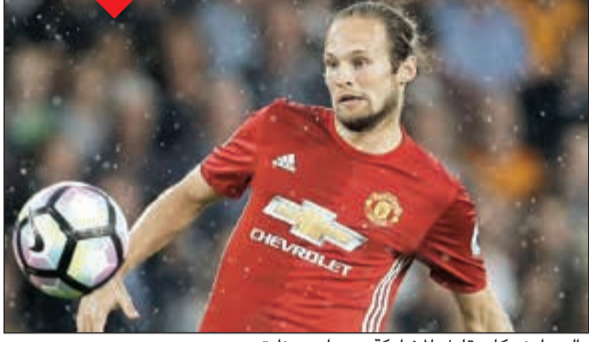
دالي بليند كان قليل المشاركة مع مان يونايتد

أعلن نادي مان يونايتد الإنجليزي لكرة القدم موافقته على بيع المدافع الهولندي دالي بليند ليعود إلى صفوف أياكس الهولندي من جديد. وخاض بليند 141 مباراة منذ انضمامه إلى «الشياطين الحمر» في عام 2014 مقابل 14 مليون جنيه إسترليني (19 مليون دولار أميركي). ومع ذلك، شارك اللاعب في 17 مباراة فقط، خلال الموسم الماضي بعد أن بدأ خارج حسابات البرتغالي جوزيه مورينيو المدير الفني للفريق. وأكد مان يونايتد التوصل إلى اتفاق لانتقال اللاعب إلى النادي الهولندي، وذلك عبر بيان بموقعه على الإنترنت، ذكر فيه «مزيد من التفاصيل ستعلن في الوقت المناسب».