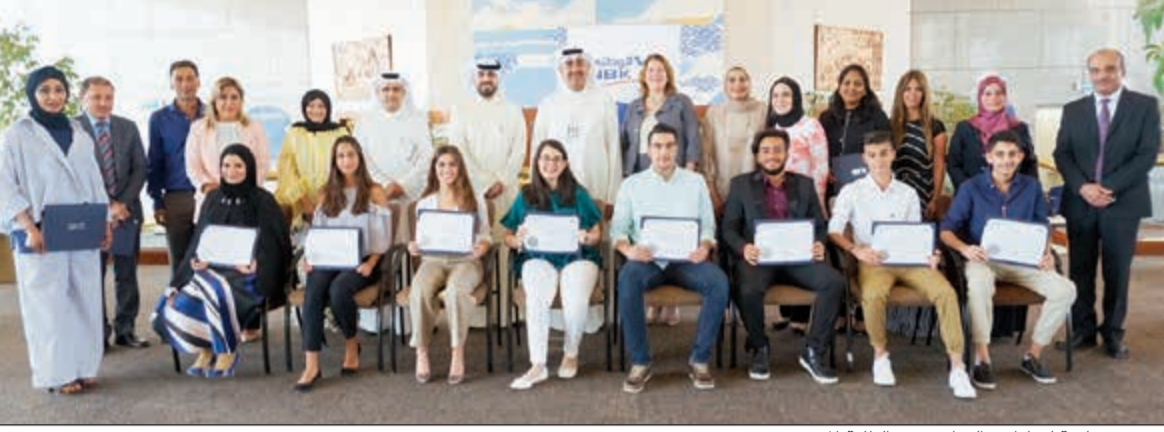
صورة جماعية لقيادات «الوطني» مع الطلبة المتفوقين

التي بوليتها البنك الوطني للمسيرة التعليمية في الكويت ولدعم الطلبة المتفوقين. يذكر أن البنك قام مؤخراً بدعم ورعاية الحفل الخاص لتكريم أوائل خريجي الثانوية العامة في المدارس الكويتية لأقسام الأبي والعملي والديني للعلم الدراسي الحالي، وذلك تأكيداً على اهتمام البنك بتلك الفئة الواعدة من الشباب الكويتي وتقديم الدعم لهم في هذه المرحلة المهمة من حياتهم الدراسية.