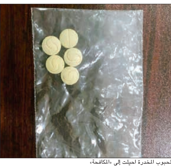
الحبوب المخدرة أحييت إلى «المكافحة»

أحال رجال جمر النويصيب يوم أمس الأول مواطناً إلى الإدارة العامة لمكافحة المخدرات إثر ضبطه وبحوزته 5 حبات يرجح أنها مخدرة. هذا، وأحيلت الحبوب إلى الأدلة الجنائية لتحديد ما إذا كانت مخدرة أم لا؟، وقال المواطن إن الحبوب للاستخدام الشخصي وإنها مهدنة. وبحسب مصدر أمنى فإن أحد رجال جمر النويصيب اشتبه في مواطن وصل إلى البلاد قادماً من دولة مجاورة بعد أن لاحظ أنه في حالة غير مترتبة فتم إخضاعه للتفتيش، حيث عثر معه على الحبوب.