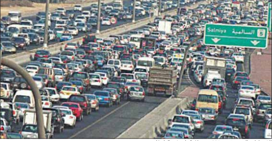
الإجراءات الجديدة ستخفف من المركبات في الطرقات