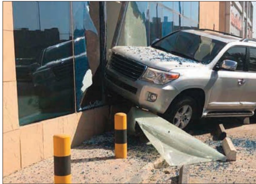
المركبة وقد اقتحمت واجهة البنك عن طريق الخطأ

أحمد خميس - محمد الدشيش توفي مواطن في حادث تصادم على طريق الفحيحيل، وفتحت أجهزة وزارة الداخلية تحقيقاً بشأن الحادثة. من جهة أخرى، تعرضت واجهة أحد البنوك المحلية في منطقة الشامية إلى تلفيات