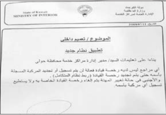
صورة زكوغرافية للتعميم

أما بالنسبة للوافدين فإن التعميم تضمن أنه في حالة تغيير مهنة اي وافد يتم إلغاء رخصة القيادة الخاصة به، خاصة إذا كانت المهنة الجديدة له لا تنطبق عليها اشتراطات القرار الوزاري، كما لن تسجل باسمه اي مركبة.