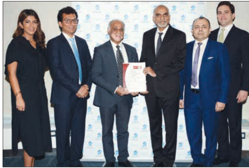
ممثلو بنك برقان خلال تسلمهم شهادة الأيزو

أعلن بنك برقان عن نجاحه في تجديد الحصول على شهادة الأيزو ISO 9001:2015 في كافة أنحاء عملياته التشغيلية، ومن خلال حصوله على هذه الشهادة، يبرهن بنك برقان مجدداً على قدرته في توفير نظام إدارة الجودة المعترف به دولياً، وبفعالية وكفاءة، إضافة إلى التطوير المستمر لمنتجاته وخدماته.