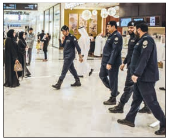
الانتشار الأمني في المجمعات لحماية العائلات من المتسكعين