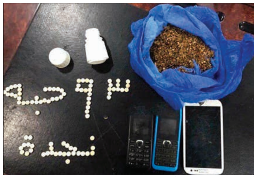
الحبوب المخدرة التي ضبطت مع مواطن في كبد

وجه وكيل وزارة الداخلية المساعد لشؤون العمليات اللواء جمال الصايغ بإحالة مواطن إلى الإدارة العامة لمكافحة المخدرات وأرْفَق في ملف القضية مادة عشبية يرجح أنها مخدرة إلى جانب 93 حبة يرجح أنها مخدرة. واستناداً إلى مصدر أمني، فإن إحدى دوريات نجدة الجهراء وخلال جولة لها في منطقة كبد اشتبهت بمركبة، فتم الطلب من قائدها التوقف، ولدى الإطلاع على أوراقه الثبوتية تبين أنه مواطن وفي حالة غير طبيعية وهو ما دفع رجال النجدة إلى إخضاع المركبة للتفتيش حيث عثروا بداخلها على كمية من المواد العشبية التي يشتبه بانها مخدرة بالإضافة إلى 93 حبة يشتبه ايضاً بأنها مخدرة. وأضاف المصدر أنه تم التحفظ على المتهم وإحالته إلى مكافحة المخدرات، أما المضبوطات فتم تسليمها إلى الإدارة العامة للأدلة الجنائية للتأكد من أنها مواد مخدرة من عدمه. ومن المقرر أن يخضع المتهم للتحقيقات في مكافحة المخدرات للوقوف على مصدره في المضبوطات وأسباب حيازته هذه الكمية وما إذا كانت لتجارة أو للاستخدام الشخصي!؟