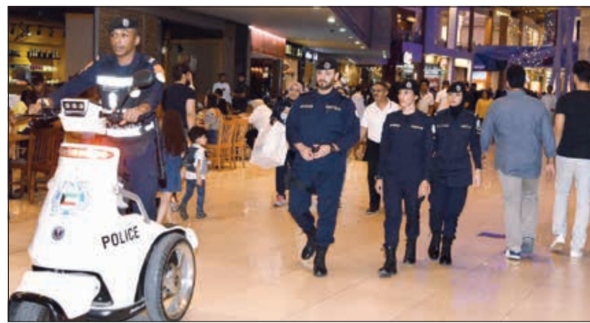
التواجد الأمني في بعض الأسواق بمشاركة عناصر من الشرطة النسائية