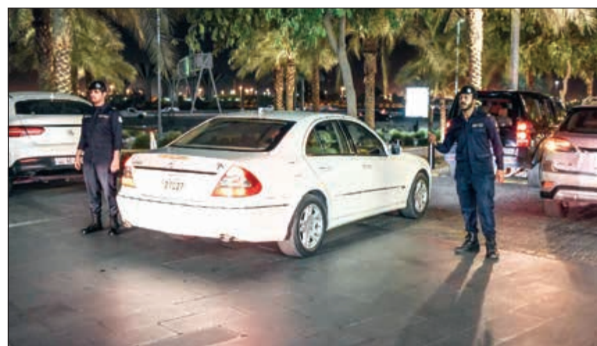
الحملة الأمنية تهدف إلى التوعية والردع

ينفذ قطاع الأمن العام بالتعاون مع القطاعات الميدانية المعنية والإدارة العامة للعلاقات والإعلام الأمني خطة أمنية متكاملة على الأسواق والمجمعات التجارية والمراكز الترفيهية تزامناً مع العطلة الصيفية، حيث تشهد تلك الأماكن إقبالا كبيرا من المواطنين والوافدين. يأتي ذلك في إطار جهود المؤسسة الأمنية لبسط مظلة الأمن والأمان في كل ربوع البلاد وتحقيق منظومة أمنية متكاملة. وذكرت الإدارة العامة للعلاقات والإعلام الأمني بوزارة الداخلية أن تكثيف التواجد