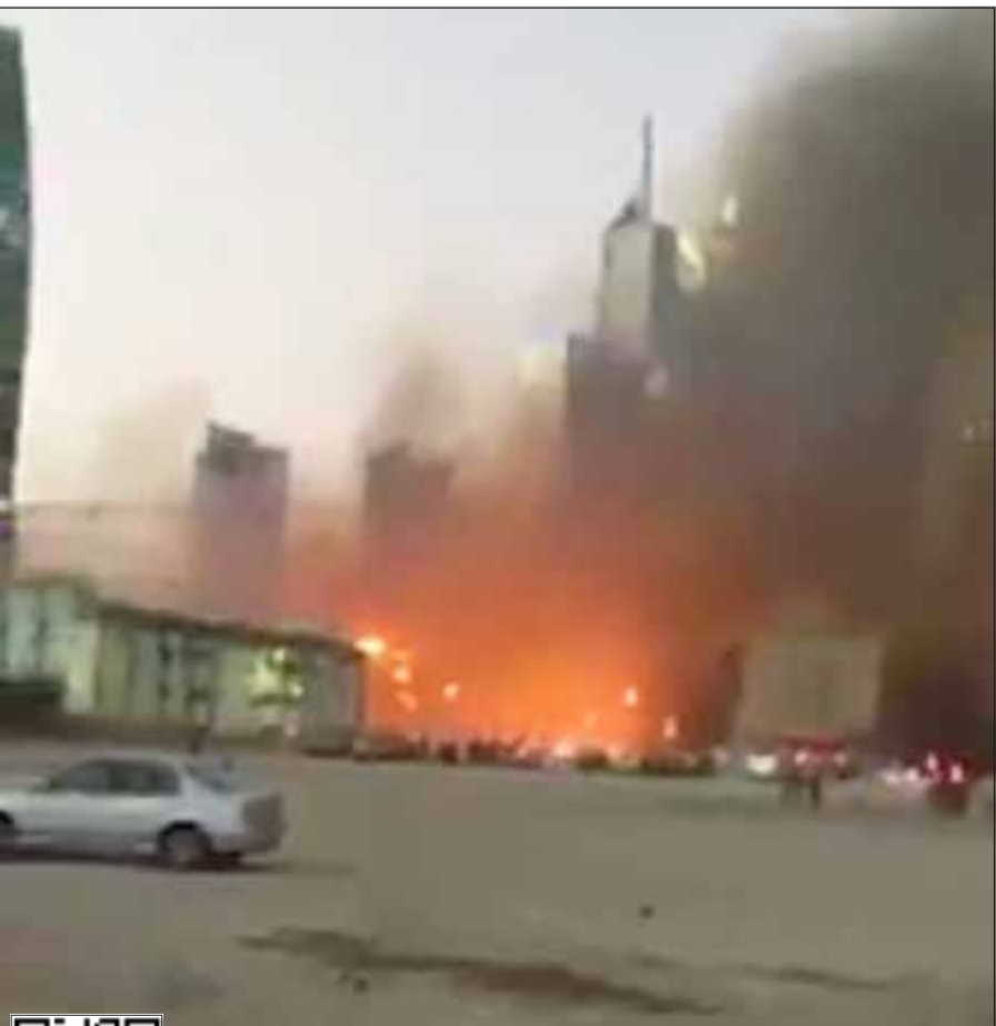
صورة من المقطع المتداول أمس الأول على وسائل التواصل الاجتماعي