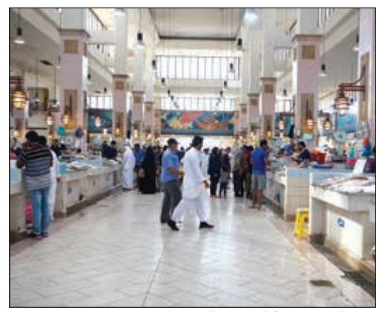
سوق السمك بحاجة إلى بعض التحسينات

وقالوا إن هذا الوضع الخدمي السيئ يدفعنا إلى المزيد من التكاليف، حيث نضطر لشراء الثلج لتبريد السمك وضمان سلامته بالإضافة إلى أن هناك مشقة في الجلوس والانتظار في هذا الجو الحار، فالتكيف يعمل ويتوقف والبرودة التي يوفرها منخفضة جداً ولا تكفي ولا تسد حاجة رواد السوق والسمك الموجود ما فيه، محذرين من تعرض بعض السمك للتلف في حال استمرار الوضع على ما هو عليه.