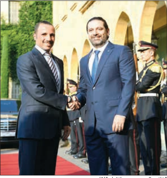
الغانم والحريري بعد انتهاء اللقاء