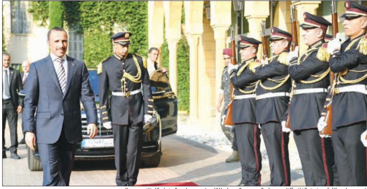
رئيس مجلس الأمة مرزوق الغانم أثناء وصوله إلى «بيت الوسط» للقاء رئيس مجلس الوزراء اللبناني سعد الحريري