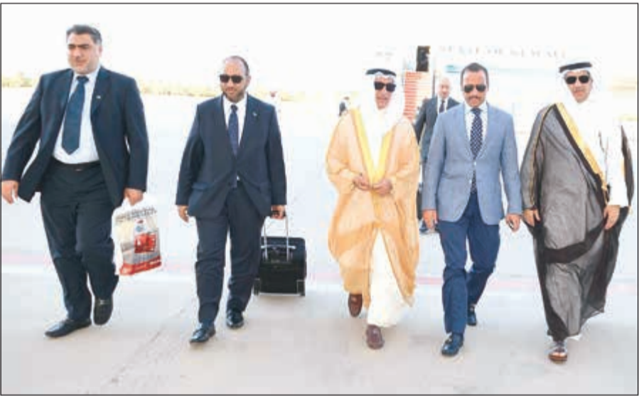
الرئيس الغانم والوفد المرافق أثناء عودتهم من بيروت امس وفي استقبالهم د. عودة الرويعي وم. عادل الخرافي

اجتمع رئيس مجلس الأمة مرزوق الغانم والوفد البرلماني المرافق امس الأول الى رئيس مجلس الوزراء اللبناني المكلف سعد الحريري. وقال الغانم في تصريح للصحافيين عقب اللقاء الذي اجري في مقر اقامة الحريري ببيت الوسط «تشرفت والإخوة في الوفد المرافق بلقاء دولة الرئيس سعد الحريري الموقر وهو صديق الكويت الوفي وكانت مباحثاتنا ايجابية تطرقنا خلالها للمواضيع التي تهم البلدين». وأضاف «كما نقلت له تحيات سمو الأمير وسمو رئيس مجلس الوزراء وتمنيات الجميع في الكويت للبنان بالاستقرار والسلام والمستقبل الباهر». وأعرب عن ثقته بقدره الحريري على مواجهة التحديات الكثيرة والكبيرة التي تواجه لبنان، معتبرا أن «مستقبل لبنان هو مستقبل الكويت واستقرار لبنان هو استقرار لكل الدول العربية وخاصة الكويت»، مؤكدا اعترازه بالعلاقة الثنائية الخاصة بين الشعبين الشقيقين في الكويت ولبنان. وقال «كما أشكر دولة الرئيس الحريري على هذه الدعوة الكريمة التي تشرفنا بتلقيها، خاصة أن المواضيع الاقتصادية هي