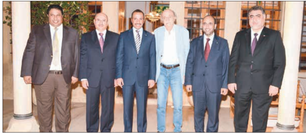
الرئيس مرزوق الغانم ورئيس الحزب التقدمي الاشتراكي وليد جنبلاط في قصر المختارة مع خالد الشطي ومحمد الدلال والحيدوي السبيعي والسفير عبدالعال القناعي

الى سفير الكويت لدى لبنان عبدالعال القناعي. كما أقام وزير الخارجية اللبناني جبران باسيل مأدبة افطار على شرف رئيس مجلس الأمة مرزوق الغانم والوفد البرلماني المرافق له. وحضر المأدبة النائبان محمد الدلال وخالد الشطي وعضو مجلس النواب اللبناني ميشيل معوض وسفير الكويت لدى لبنان عبدالعال القناعي. وعاد رئيس مجلس الأمة مرزوق الغانم والوفد البرلماني المرافق له إلى البلاد مساء الأربعاء في 26 الذي عقد في