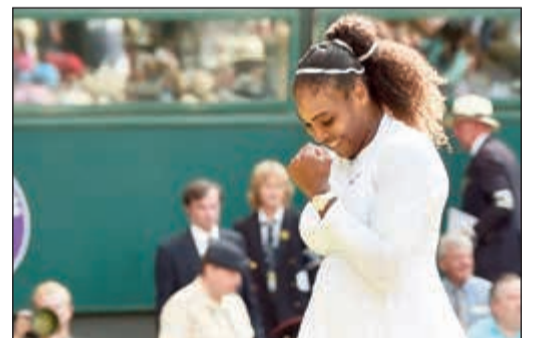
الأميركية سيرينا ويليامس نجحت في الوصول إلى نهائي ويمبلدون

نجحت الأميركية سيرينا ويليامس في تحدي الصعاب التي واجهتها في الأشهر الأخيرة منذ وضع مولودتها الأولى في سبتمبر، لتتأهل إلى المباراة النهائية لبطولة ويمبلدون الإنجليزية، ثالثة البطولات الأربع الكبرى للتنس، حيث ستكون أمام فرصة معادلة رقم الأسترالية مارغريت كورت المتوجة بـ 24 لقبها كبيرا. وبلغت سيرينا (36 عاما) المصنفة أولى عالميا سابقا، المباراة النهائية لثالثة البطولات الأربع الكبرى، للمرة العاشرة في مسيرتها، بفوزها في نصف النهائي على الألمانية جوليا غورغيس بـ 2-6 و6-4 الخميس، لتتلاقى السبت مواطنتها الأخيرة أنجليك كيربر الفائزة على اللاتفية يليانا أوستانكو.