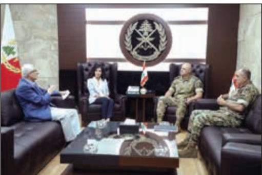
العماد جوزف عون مستقبلا رئيسة جمعية بيروت ماراثون، في الخليل