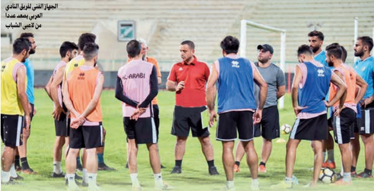
الجهاز الفني لفريق النادي العربي يصعد عددا من لاعبي الشباب

أما العميد الهيم فتناول آخر الاتصالات مع الاتحاد الدولي للرياضة العسكرية «السيزم»، وكذلك التحضيرات من قبل المؤسسة العسكرية بهدف توفير أعلى نسب النجاح لهذا الاستحقاق الذي يقام لأول مرة في لبنان.