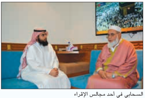
السحابي في أحد مجالس الإقراء

الاطلاق أن احتسيت الكحول. وهل يمكن أن أضيف هنا أنني لم أدخن على الإطلاق فهي عادة دمرة كذلك. ولذا أصابني دهمشة عظيمة عندما علم الشيخ الزنداني عن معتقداتي وممارساتي بعد مناقشة معه، فقال إنني في واقع الأمر كنت مسلماً بالسلوك. ولذا كنت سعيداً بأن أعلن لكل من يسألني عن معتقداتي وممارساتي بانتي متوافق مع الإسلام في ذلك. ولذا أيضاً كنت بالغ السعادة بأن انضم خلال هذا الأسبوع إلى اشقائي لهذا الفيض من مشاعر الصداقة والأخوة من الإخوة والأخوات، التي أطروني بها، وبهذا سأظل ما أحببت شاكرًا لفضل الله. صاحبتي الدهشة عندما علمت بالعلاقة بين العلم والإسلام. إننا، كما تعلمون، لا نعلم علوم النزر للدين عن الإسلام في بلادنا الغربية. فالقرآن والحديث لا يطلع عليهما أحد هناك. اعتقد أن العالم الإسلامي لا يشع بنوره كما ينبغي في الغرب، كما تفعل بعض الديانات الأخرى. أريد أن أعرف لأخواتي وإخوتي المسلمين يجب أن يقولوا من الإسلام في العالم الغربي وأن ندرك أن مادية الغرب هي نتيجة لتطعم العلم، ونحن نستطيع كسملين نتجيم هذه المادية بلانتهج العلمي نفسه أيضاً. اعتقد أنه يتعين على المسلمين وعلى القيام بهذه المسؤولية لتطوير معارفنا المتعلقة بالكلان البشري في هذا العالم. وهذا كله في سبيل الله خالقنا جميعاً.