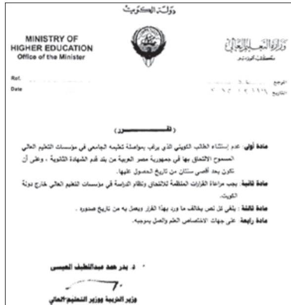
القرار المطعون عليه