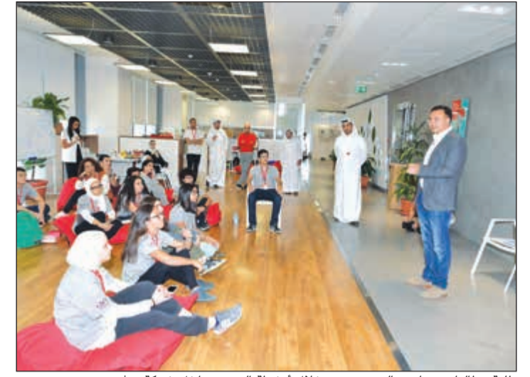
طلبة وطالبات برنامج «البروتيجيز» خلال أنشطة التحدي داخل شركة ooredoo