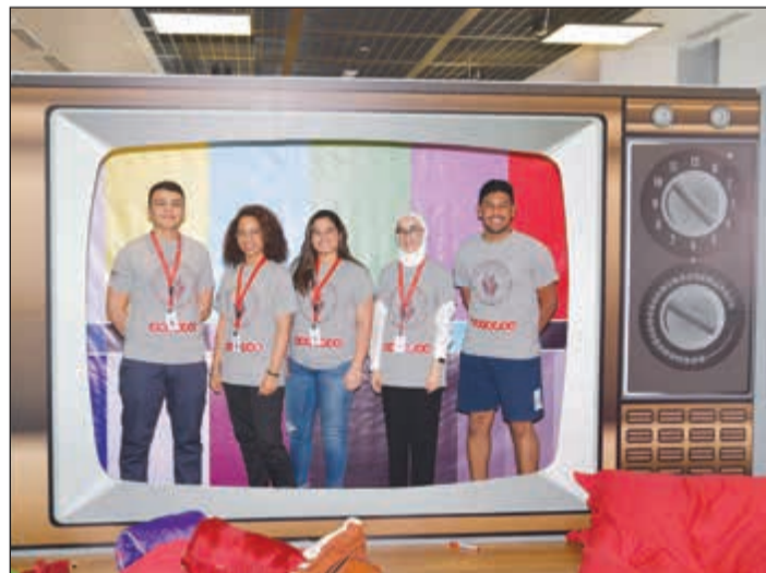
عدد من طلبة وطالبات البروتيجيز في صورة تذكارية بمقر ooredoo