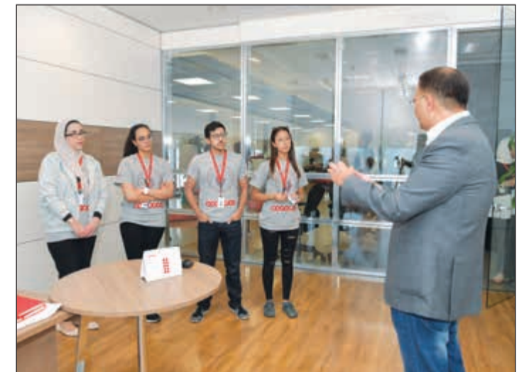
من أنشطة التحدي داخل شركة ooredoo