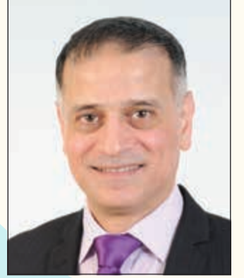
إعداد: د. طارق البكري

التواصل مع الصفحة بملئكم بريدي: DOCBAKRI@YAHOO.COM / الواتساب: 97860918