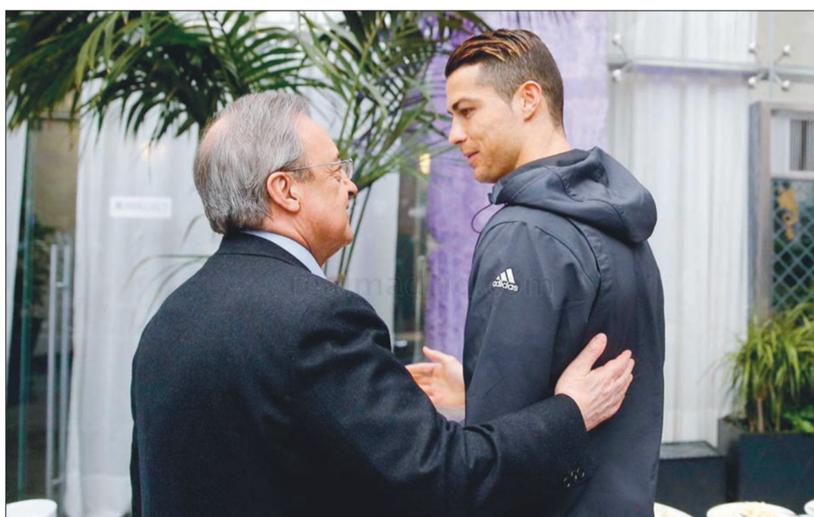
رئيس نادي ريال مدريد فلورينتيو بيريز والبرتغالي كريستيانو رونالدو

الماضي، وكان ذلك هو ما حدث تحديداً مع الأرجنتيني ليونيل ميسي. ومن المنتظر أن يصدر الحكم قريباً في هذه القضية، ويرى الكثير من المتابعين أن ذلك سيكون على الأرجح مع مطلع الأسبوع المقبل. وأضاف المصدر المقرب من مانشستر يونايتد في الرحيل من خلال وكيل أعماله، خورخي مينديز. وأدار النادي الملكي ان رونالدو يرغب في الرحيل عن إسبانيا، وهو ما دلت عليه السنوات الماضية بشكل واضح.