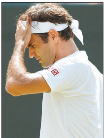
روجر فيدرر أخفق في إحراز لقبه التاسع بويمبلدون

ودع السويسري روجر فيدرر حامل اللقب منافسات فردي الرجال في بطولة ويمبلدون للتنس بعد هزيمته في دور الثمانية أمام كيفن أندرسون لاعب جنوب أفريقيا امس. وخسر فيدرر، الذي سبق له الفوز بالبطولة ثمانية مرات، بنتيجة 2-6 و6-7 و7-6 أمام أندرسون المصنف الثامن. وواجه فيدرر الذي كان يسعى لتعزيز رقمه القياسي وإحراز لقب البطولة للمرة الثالثة من منافسه أندرسون، حيث كان قد تمكن من الفوز بالمجموعتين الأولى والثانية الا ان أندرسون تفوق على نفسه ومستردكا الموقف لينجح في الفوز بمجموعتين ثم بالمجموعة الخامسة والتي حسمها لصالحه 13 - 11.