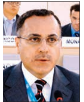
السفير جمال الغنيم

وأكد السفير الغنيم حرص الكويت على تعزيز العلاقات الطويلة والخميرة مع المنظمة الدولية للهجرة والتي تصب في نهاية المطاف في خدمة العمل الإنساني الدولي.