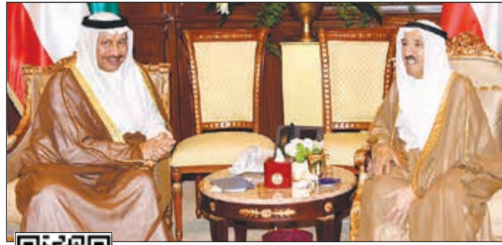
صاحب السمو الأمير الشيخ صباح الأحمد مستقبلا سمو الشيخ جابر المبارك

واستقبل سمو ولي العهد بقصر بيان أمس نائب رئيس مجلس الوزراء ووزير الداخلية ووزير الدفاع بالإنيابة الشيخ خالد الجراح.