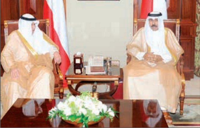
سمو ولي العهد الشيخ نواف الأحمد مستقبلا الشيخ خالد الجراح

استقبل سمو ولي العهد الشيخ نواف الأحمد بقصر بيان صباح أمس مجلس الأمة مرزوق الغانم.