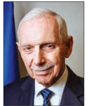
السفير وليام سوينغ

جنيّف - كونا: قال المدير العام للمنظمة الدولية للهجرة السفير وليام سوينغ أمس الأربعاء «إن كلمات الشكر لا تكفي لتقديمها الى صاحب السمو الأمير الشيخ صباح الأحمد لما يقدمه من دعم سخّي للعمل الإنساني في اليمن». جاء ذلك في تصريح لـ«كونا» عقب اجتماعه مع مندوبينا الدائم لدى الأمم المتحدة والمنظمات الدولية الأخرى في جنيف السفير جمال الغنيم لمناقشة الدعم الكويتي المخصص لبرامج المنظمة في اليمن. وقال سوينغ إن «ثلاث سنوات من الصراع في اليمن تسببت في معاناة الملايين ما أثر على المدنيين ومع استمرار