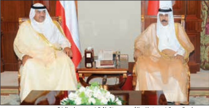
سمو ولي العهد الشيخ نواف الأحمد مستقبلا الشيخ صباح الخالد