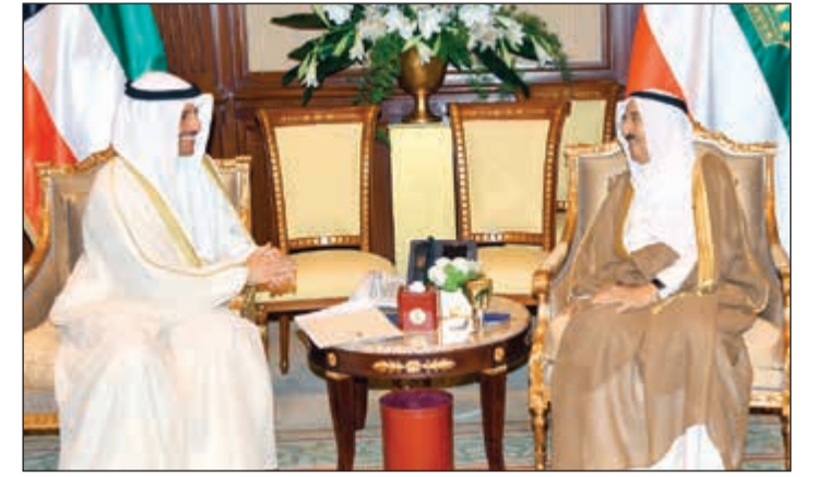
صاحب السمو الأمير الشيخ صباح الأحمد مستقبلا رئيس مجلس الأمة مرزوق الغانم

خالص تهنائه بمناسبة العيد الوطني لبلادها، متمنيا له موفور الصحة والعافية.