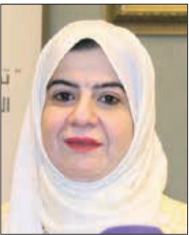
د. ماجدة القطان

الوزارة لموسم الحج التي شملت ثلاث مراحل (قبل وأثناء وبعد عودة حجاج بيت الله). ولفتت إلى أن المجتمعين بحثوا أيضاً ما يتعلق بزيارة فريق قطاع الصحة العامة المرافقة للجنة مسان الحجاج للاطلاع عليها ومعرفة مدى مطابقتها لشؤون الصحة العامة في الوزارة. د. ماجدة القطان في تصريح صحافي أمس الأربعاء عقب اجتماعها مع اللجان والفريق المشكلة لتنظيم عملية تجهيز واستقبال الحجاج والوقوف على الخطط والبرامج المعنية إن هذه الجاهزية تنطلق من اهتمام الدولة واستراتيجية وخطط وبرامج الوزارة بتأمين صحة حجاج الكويت. وأضافته أن الوزارة قامت أيضاً بمراجعة جميع التجهيزات ومتابعة سير عمل الفرق المنظمة لاستقبال الحجاج في مكة المكرمة وقد تناول الاجتماع مناقشة خطة