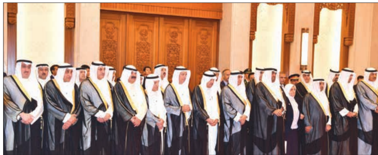
أعضاء الوفد الكويتي لدى توقيع إحدى الاتفاقيات