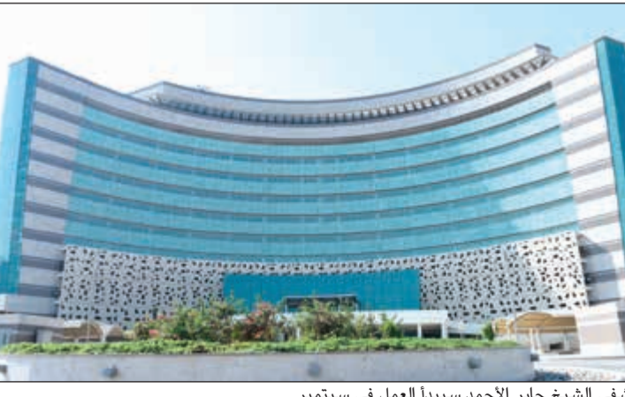
مستشفى الشيخ جابر الأحمد سيبدأ العمل في سبتمبر

قصيرة، خاصة مع عدم توفير الدرجات الوظيفية للكوادر، ووقف كل الميزانيات المطلوبة للتشغيل. التحدي الكبير والمهمة شبيهة بالمهمة شبيهة المستحيلة تضع وزارة الصحة أمام اختيار لقرارها لتشغيل مبنى مستشفى جابر في ظل تداول المعلومات حول تسليمه لإحدى الشركات الخاصة مستقبلاً لإدارته. وبين هذا وذاك، هل سيصبح حلم المواطن حقيقة بأن يتلقى الخدمة الطبية بمستشفى جابر خلال الفترة المقبلة أم أن العجلة ستدور حول نفسها، ويبقى المستشفى مثل تحفة أثرية في منطقة جنوب السرة؟