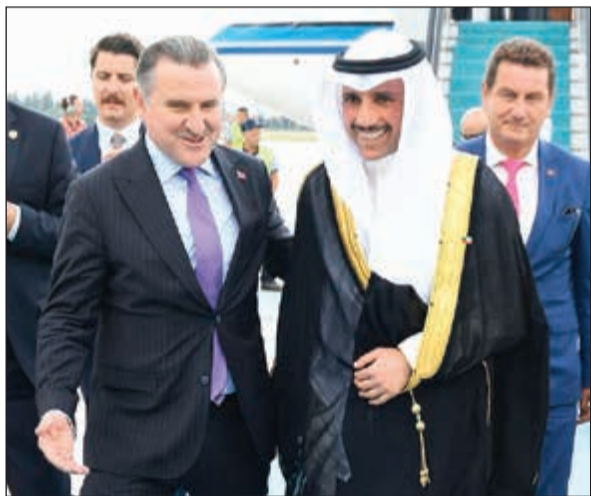
مثل صاحب السمو الأمير رئيس مجلس الأمة مرزوق الغانم لدى وصوله تركيا