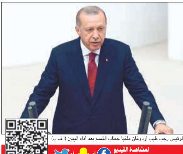
الرئيس رجب أردوغان ملقيا خطاب القسم بعد أداء اليمين

عواصم- وكالات: طوت تركيا صفحة النظام البرلماني رسميا أمس مع أداء الرئيس رجب طيب أردوغان اليمين الدستورية أمام البرلمان، ليصبح أول رئيس بسلطات معززة في النظام الرئاسي الجديد. وقد تعهد في خطاب القسم بالحفاظ على تركيا العلمانية التي أسسها مصطفى كمال أتاتورك، واعداء الأتراك بمستقبل «أفضل».