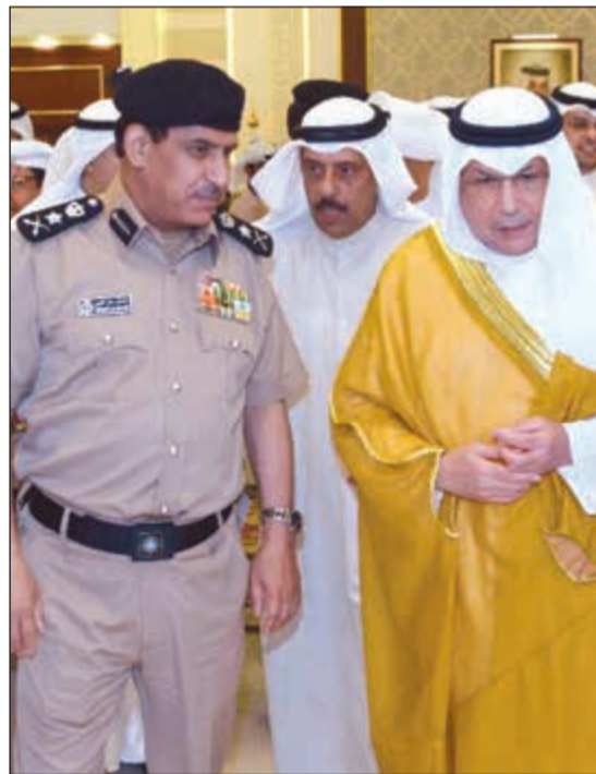
الشيخ خالد الجراح والفريق عصام النهام خلال حفل استقبال المهنيين

أعلن نائب رئيس مجلس الوزراء وزير الداخلية الشيخ خالد الجراح أن الهيكل التنظيمي للوزارة سوف يعلن قريباً، مشيراً إلى أن التغيير سيظل كافة قطاعات الداخلية، مؤكداً أن تدوير وتعيين وكلاء الوزارة المساعدين والمديرين العامين ومساعديهم سيتم خلال الشهر الجاري، وستكون من صلاحيات وكيل الوزارة الفريق عصام النهام وهو ما يعد تأكيداً لما نشرته «الأنباء» قبل شهرين، وحول ترقيات الضباط من مختلف الرتب، قال الجراح إنها سترى النور قريباً. جاء ذلك في الحفل الذي أقيم أمس في قاعة الفريق م.الشيخ أحمد عبدالله الخليفة الصباح بمقر وزارة الداخلية «مبنى نواف الأحمد» بمنطقة صباح لاستقبال مهنتي وكيل وزارة الداخلية الفريق عصام النهام بمنصبه الجديد. وفي سياق آخر، أصدر الجراح تعليماته لوكيل وزارة الداخلية الفريق عصام النهام، بحضور افتتاح ستة مراكز لتسليم الجوازات الإلكترونية الجديدة بدءاً من الأسبوع المقبل لتضاف إلى المراكز الستة الموجودة بالفعل ليصبح عدد مراكز تسليم وتسليم