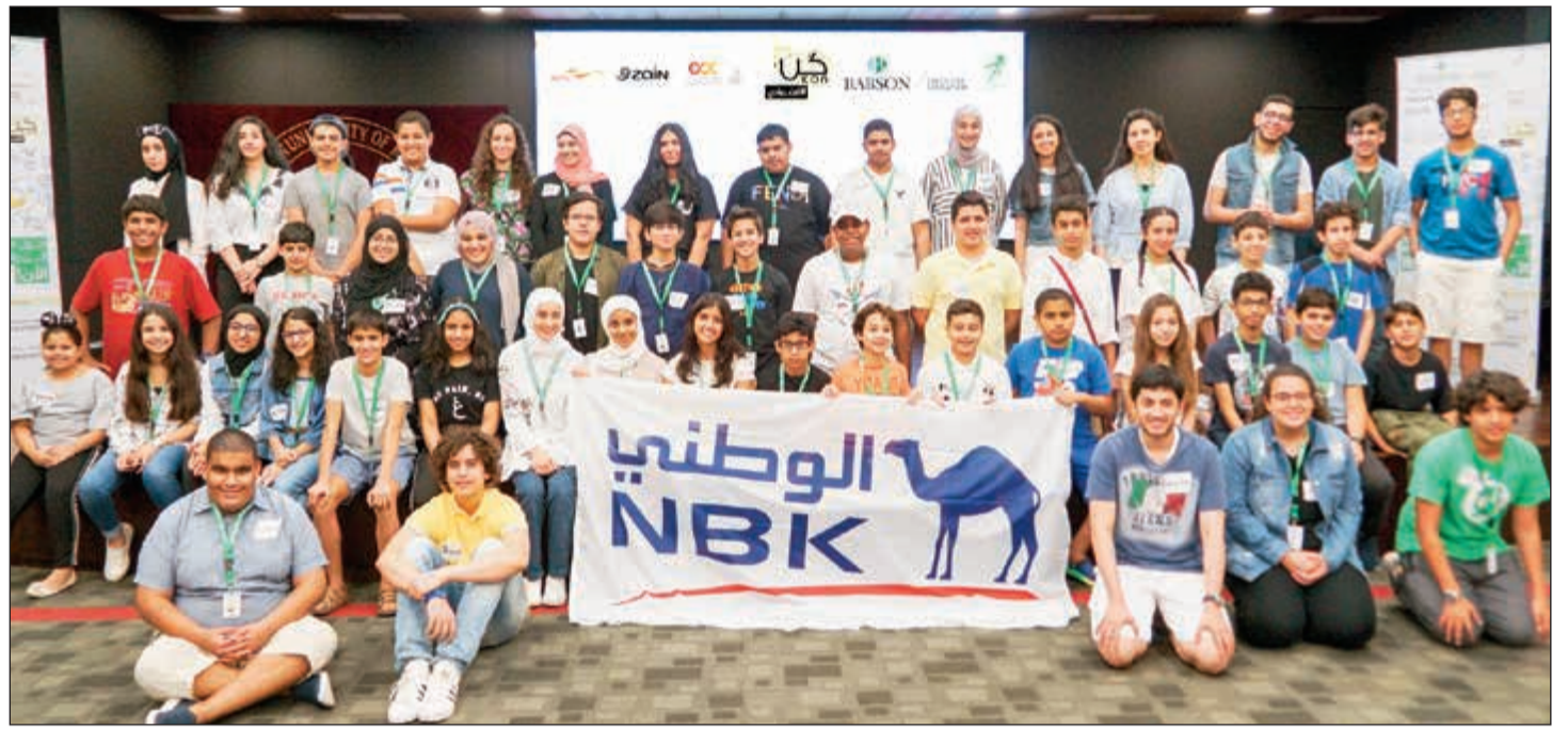
عدد من المشاركين في برنامج «كن» في لقطه جماعية

فإنها التحفة الفنية المذهلة لتضيف لك إطلالات مختلفة تمنحك الخيارات المتعددة لجميع المناسبات، حيث تم التركيز على الألوان في هذه التشكيلة لتتوافق مع جميع الحللي التي تترزين