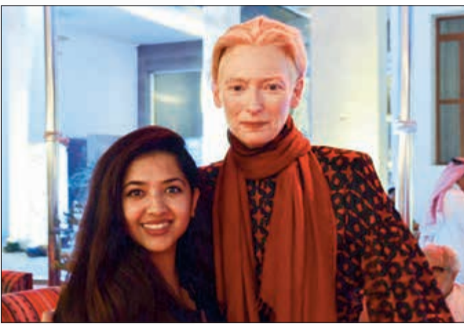
مع الكاتبة والممثلة Tilda Swinton