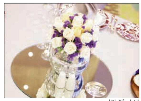
اهتمام بأرق التفاصيل

ونظرا لقدرتها على استضافة 650 شخصا خلال حفل استقبال، تعد هذه القاعة وتوقعاتهن بالشكل الأمثل ويضمن الفندق الرائد إرضاء جميع الأذواق مع قاعتين متميزتين تم إعدادهما لاستضافة الحفلات المترفة على نطاق كبير أو صغير وفريد، والتمتع بباقة الأفراح الفريدة والخاصة بأفراح موسم الصيف، وتقع القاعات اللتان تتميزان بتصاميم أخاذة ويمكن تطويعهما وفقا للمتطلبات الشخصية في الطابق الثاني من الفندق، وتوفران باقة وأسرة من الخيارات التي تواكب جميع