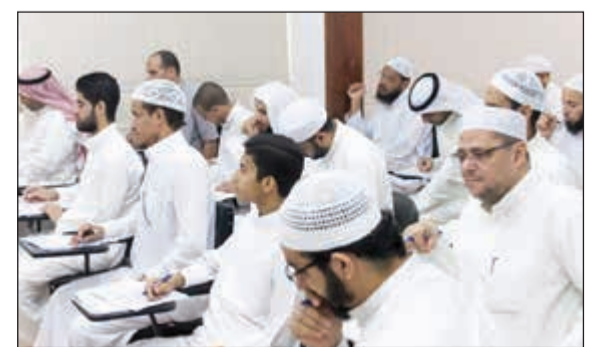
المتدربين خلال الاستماع للمحاضرات

الخير على المساهمة في دعم إقامة حلقات حفظ القرآن والدورات المتخصصة في علوم القرآن من خلال الاتصال بالخط المباشر: 97268888 أو زيارة جمعية النجاة الخيرية. من جانبهم، أشاد الطلاب بالجهد الذي قدمه المحاضر خلال الدورة، وبحسن التنظيم من «حلقات ورتل» ومعهد كامز وأكروا على استفادتهم الكبيرة منها ورغبتهم في حضور المزيد من هذه الدورات المتخصصة في المستقبل، وفي ختام الدورة تم منح شهادة حضور لجميع المشركين، وإجازة بالسند المتصل من الأخرى.