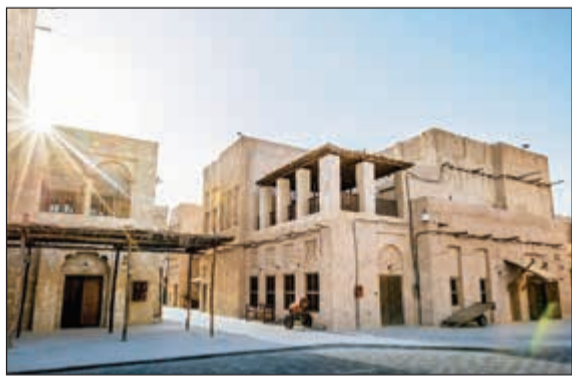
تجربة تجمع بين عبق الماضي وأصالة الحاضر

وأضاف اليساندرو: حرصنا على تصميم غرف الفندق وردماته بعناية فائقة لضمان منح الزوار تجربة غامرة تعقب بأصالة الماضي في مكان يمنحهم شعورا بالقرب من الحياة العصرية التي تنبض بها أسارة دبي، وبما أن الفندق يضم 200 غرفة ضمن 22 مبنى منفصلا، يحظى الزوار بفسحة للاسترخاء كما لو أنهم في زيارة لصديق أو قريب، ويستمتعون الزوار من خوض تجربة لا تضاهي مزج بين حفاوة الضيافة العربية في بيئة تعقب بإرث الماضي والفنون العمرانية الفريدة، ويعيد الفندق إحياء الأيام الغابرة ويوفر خيارا مريحا للمسافرين الشغوفين بالتراث والتاريخ، ويمنحهم وجهة مثالية للاستمتاع بالتجارب المميزة في مساحات ذات تصاميم فريدة تحاكي التاريخ الإماراتي العريق.