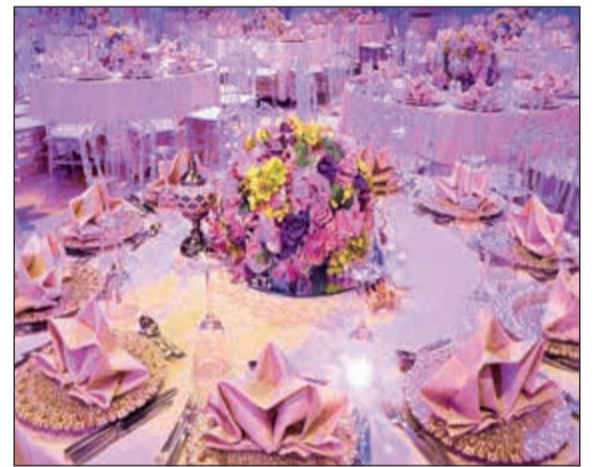
قاعات سيمفوني، الخيار الأمثل

من الطاولات والكراسي إلى أدوات المائدة والديكور، بهدف إحياء احتفال مهير. ومن جهة أخرى، تضيء الثريات الذهبية الجذابة المزيد من السحر على القاعة المزودة بأحدث المعدات السعوية والبصرية لتحويلها إلى مكان فأتان بأسر الألباب يليق بحفل زفاف استثنائي، ويمكن للعروسين اللذين ينتشدا إحياء مناسبة أكثر خصوصية اختيار قاعة بريسم التي توفر معايير الجودة ذاتها وسط أجواء حميمية وأسرة لا تقل جانبية عن القاعة الأولى، حيث تسهم الألوان الجميلة في جعلها مكانا مفعما بالحياة يرتقي إلى مستوى أحلام أي عروس في حفل زفاف لا ينسى، وتستوعب القاعة الـ 150 شخصا ما يسمح للعروسين بمشاركة يومهما الخاص مع الأصدقاء والعائلة والاستمتاع بمائدة العشاء المفتوحة والغنية بأفضل أصناف المأكولات العالمية.