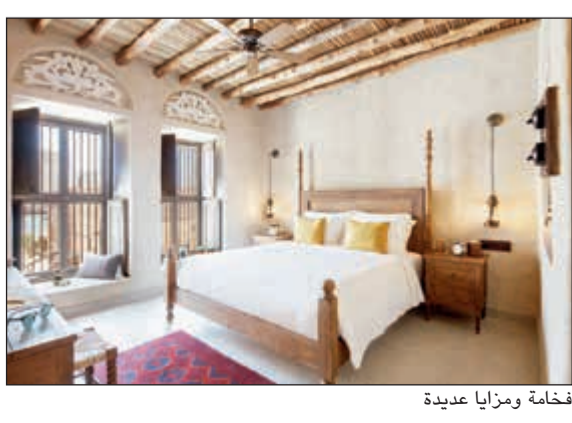
فخامة ومزايا عديدة

ويترعب الفندق الجديد وسط المنازل التراثية والأفنية الفسحة في السوق الممتد على ضفاف خور دبي، ويحتضن 200 غرفة موزعة في 22 منزلا مميّزا تزدان بتصاميم تراثية، ومزينة بأبراج الرياح «البراجيل» الشهيرة في جميع أنحاء المنطقة، ويقدم الفندق إطلالات أسرية على أزقة السوق القديم المجاور، فضلا عن الإطلالة المائية الرائعة على خور دبي، ويستوحي تصميمه من الحكايات العربية التراثية الأصيلة والأرث الإماراتي العريق، إذ يجسد في مفهومه تقاليد الضيافة العربية العريقة.