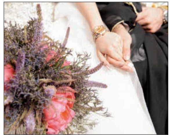
أجواء فريدة ليلة لا تنسى