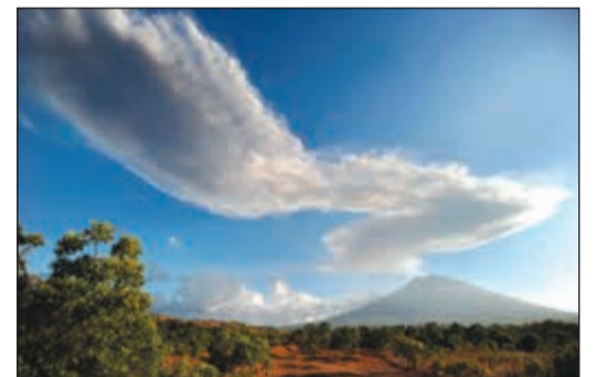
الرماد البركاني يتصاعد من فوهة بركان جبل أجونج

جاكرتا - دب.أ: ذكر مسؤول إندونيسي أن جبل أجونج الواقع في جزيرة بالي الإندونيسية، أطلق أمس الخميس رمادا بركانيا بارتفاع 2800 متر، ولكن دون توقعات بحدوث «ثوران مدمر». وقال سوتوبو نوجروهو، المتحدث باسم الإدارة الوطنية لإدارة الكوارث: «ما زالت الحمم البركانية تتصاعد إلى السطح، لذا فمن المرجح أن يكون هناك مزيد من الانفجارات».