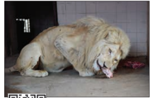
اسد في حديقة حيوانات كراتشي

لمشاهدة الفيديو يمكن استخدام QR كود أو f أو ا أو ا