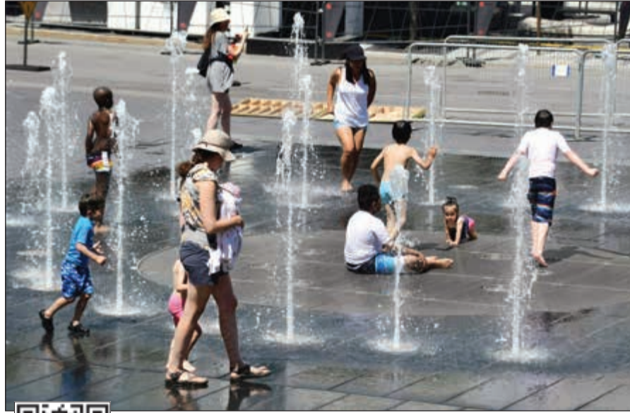
أطفال يهربون من الحر إلى إحدى نافورات مونتريال