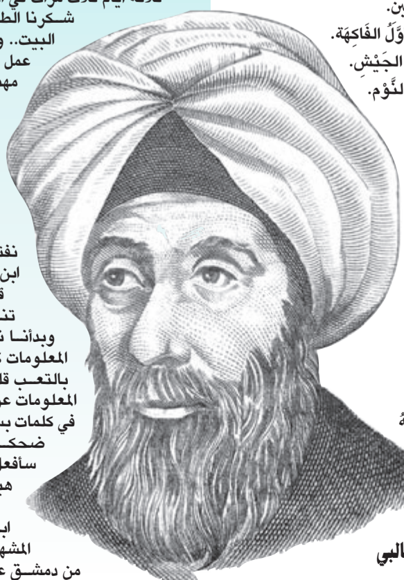
من كتاب فقه اللغة للثعالبي

شعرت يوما بالأم في بطني فأسرع أبي وأخذني إلى المستشفى.. وكانت أول مرة أذهب فيها إلى المستشفى.. استقبلني الطبيب وفحصني جيدا ثم ابتسم وهو يقول: لا شك أن صهيبا يندخل علينا.. هيا انهض يا صهيب.. فأنت على أحسن حال.. وسوف أعطيك دواء طعمه «الذيد» تتناوله ثلاثة أيام ثلاث مرات في اليوم حتى لا توجع بطنك.. شكرنا الطبيب.. ثم صافحناه وعدنا إلى البيت.. وكنت سعيدا بما شاهدته من عمل الطبيب.. قلت لأبي: «أحببت مهنة الطبيب يا أبي». قال: «نعم يا صهيب.. هذه مهنة من أشرف المهن وأجملها.. وعسى أن تراك مثل ابن النفيس الطبيب الأنياب يوما ما».. قلت بهيمنة: «ومن هو ابن النفيس يا أبي؟». قال: «خذ دواء الآن.. وهيا بنا نفتح الإنترنت لنتعرف أكثر على ابن النفيس الطبيب».. قلت بحماس: «هيا بنا فورا».. تناولت الدواء ثم جلست مع أبي وبدأنا نبحث في الإنترنت.. وكانت المعلومات كثيرة جدا.. فقال أبي: «أشعر بالتعب قليلا.. ما أريك لو تجمع بعض المعلومات عن هذه الشخصية ثم توجزها في كلمات بسيطة». ضحكت وأنا أقول: «اطمئن يا أبي.. سأفعل.. يبدو أنك أصبحت عجوزا.. هيا انهض لترتاح وأنا ساقب هنا».. وتابعت البحث، وعرفت أن ابن النفيس من الأطباء العرب المشهورين.. وقد ولد في قرية قريبة من دمشق عاصمة سورية اليوم، في العام