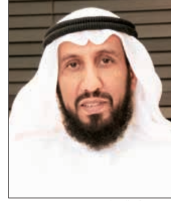
الشيخ خالد الخراز