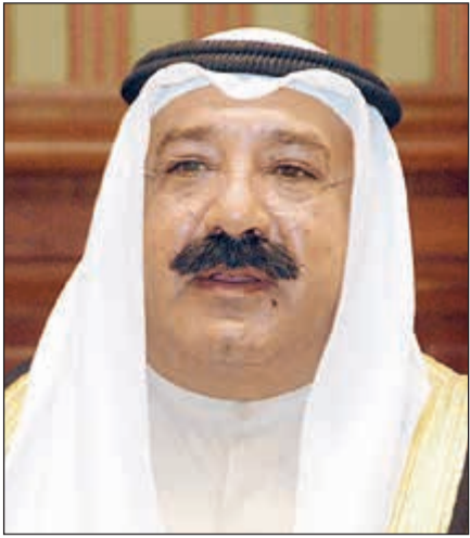
الشيخ ناصر صباح الأحمد

الخميس إن الشيخ ناصر صباح الأحمد أعرب في رسالة بعثها إلى الملك جيغمي سينغي وانغشاك عن جليل شكره وتقديره للرسالة التي عبرت عن «صدق مشاعركم تجاهنا». وتمنى الشيخ ناصر صباح الأحمد ملك بوتان التمتع بنعمة الصحة والعافية ولشعبه وبلده بنعمة الأمن والأمان.