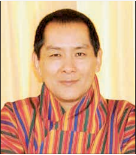
ملك بوتان جيغمي وانغشاك

الخميس إن الشيخ ناصر صباح الأحمد أعرب في رسالة بعثها إلى الملك جيغمي سينغي وانغشاك عن جليل شكره وتقديره للرسالة التي عبرت عن «صدق مشاعركم تجاهنا». وتمنى الشيخ ناصر صباح الأحمد ملك بوتان التمتع بنعمة الصحة والعافية ولشعبه وبلده بنعمة الأمن والأمان.