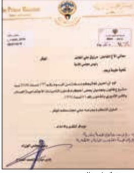
صورة كتاب الرد