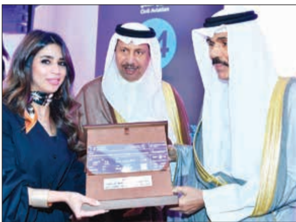
هدية لسمو ولي العهد من ابنائه المهندسين المشرفين على المشروع