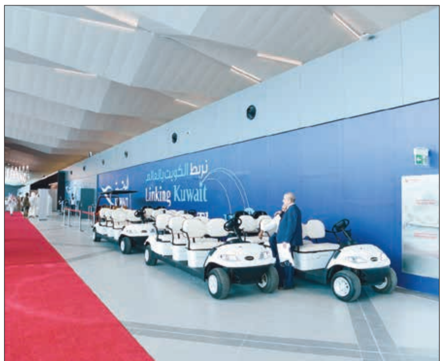
تجهيزات متكاملة لراحة المسافرين