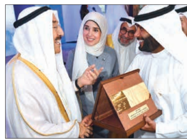
هدية لصاحب السمو من أبنائه المهندسين المشرفين على المشروع