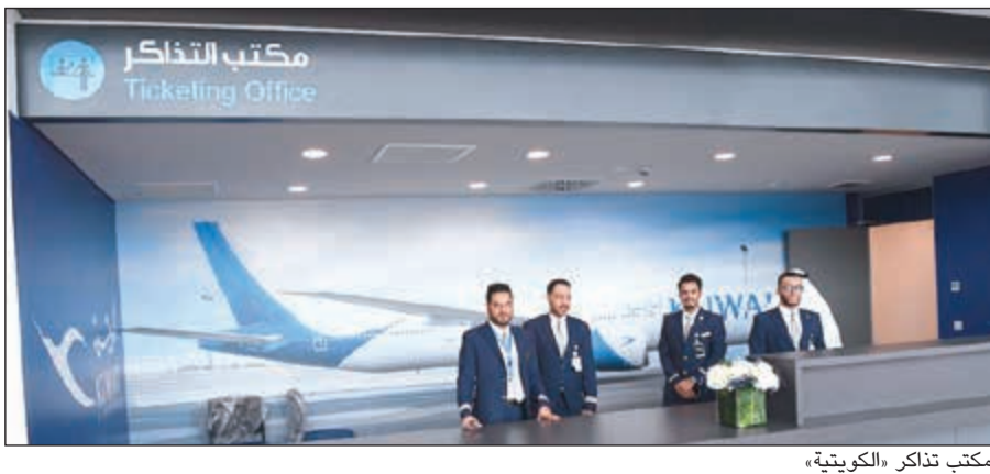
مكتب تذاكر «الكويتية»

وتوجهات ومتابعة مباشرة من سمو رئيس مجلس الوزراء الشيخ جابر المبارك، على أن تكون استراتيجية إنشاء مبنى الركاب رقم 4 بمطار الكويت الدولي نموذجا جديدا في عمل السلطة التنفيذية وذلك عبر استقطاب أفضل الخبرات العالمية في مجال إدارة وتشغيل المطارات والتي ترجمتها علاقة التعاون مع شركة الخسوط الجوية للشباب الكويتي وتدريب كوادر الطيران المدني الكويتية على أحدث ما وصلت إليه تقنيات هذا المجال في العالم. وزادت: إننا أمام مشروع تحول إلى واقع وفقا لبرنامجنا الزمني المقرر حيث سيدشن أعماله وخدماته مع شركائنا الكويتية في الشهر المقبل، وهي مجرد خطوة تتبعها إن شاء الله خطوات أخرى أبعد وأعمق وأكبر بما يمهّد الطريق لتحقيق بعض ما تصبون إليه سموكم من أجل الكويت وبما يقر أعينكم بما ترونه حولكم من إنجازات وجهود مخلصّة