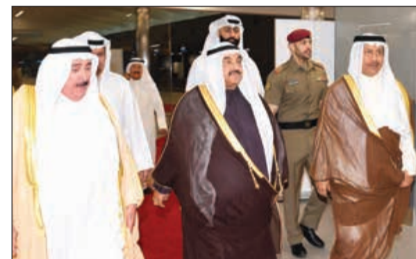
سمو الشيخ ناصر المحمد وسمو الشيخ جابر المبارك والشيخ سالم صباح الناصر