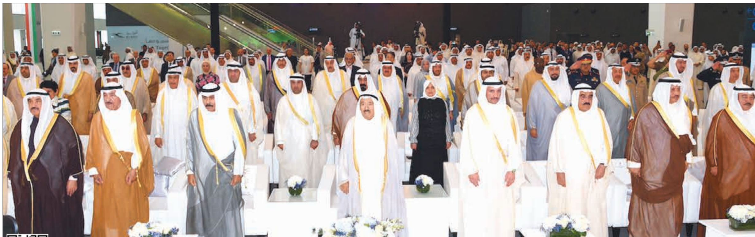
صاحب السمو الأمير الشيخ صباح الأحمد وسمو ولي العهد الشيخ نواف الأحمد ورئيس مجلس الأمة مرزوق الغانم والشيخ جابر العبدالله والشيخ فيصل السعود وسمو الشيخ ناصر المحمد وسمو الشيخ جابر المبارك والشيخ دسالم الجابر في مقامة الحضور