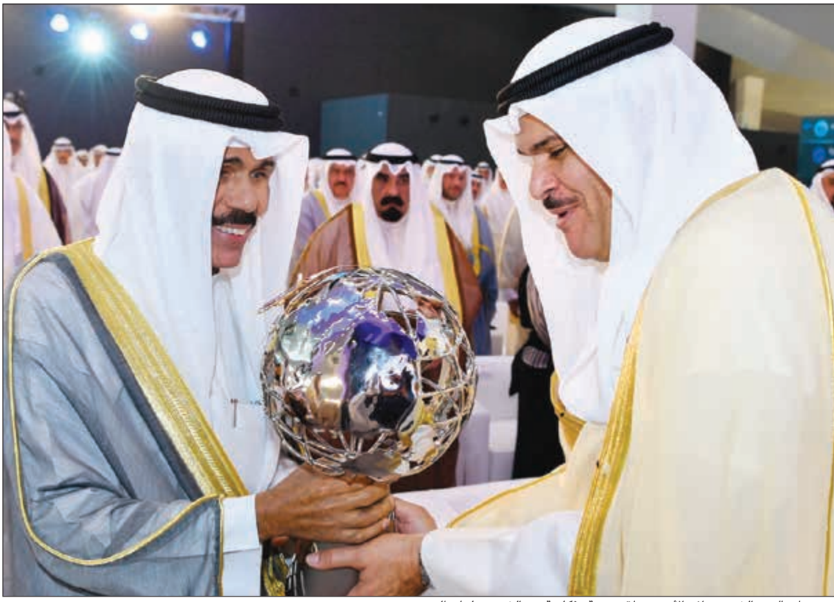
سمو ولي العهد الشيخ نواف الأحمد يتلقى هدية تذكارية من الشيخ سلمان الحمد