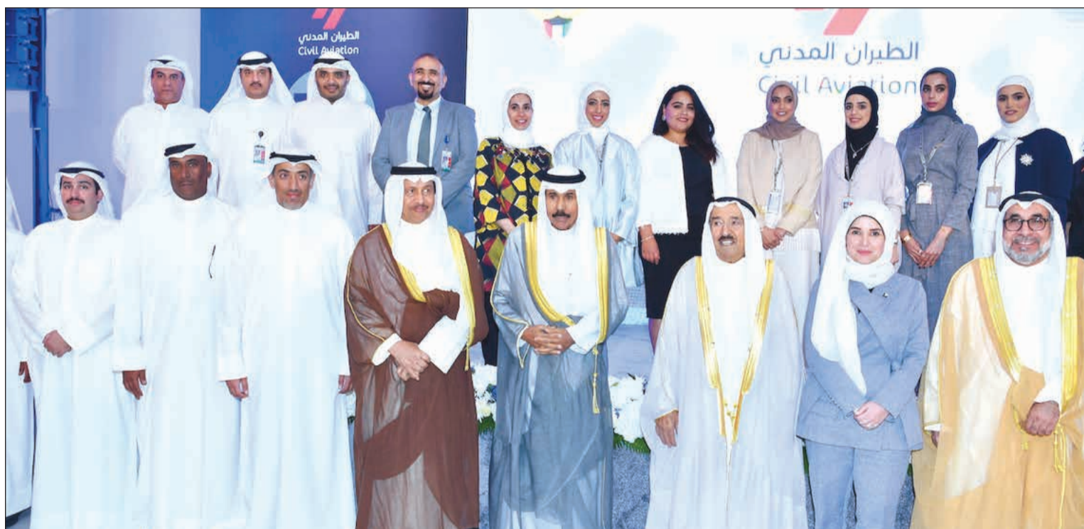
صاحب السمو الأمير الشيخ صباح الأحمد وسمو ولي العهد الشيخ نواف الأحمد ودجنان بوشهري وم. يوسف الفوزان وعدد من العاملين في الطيران المدني