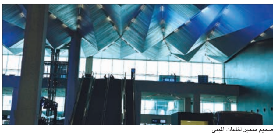
تصميم متميز لقاعات المبنى

بإذن الله رؤيتكم السامية للكويت (2035) وآمالكم المهمة باستعادة مكانتها المرموقة كمرکز مالي وتجاري إقليمي رئيسي.