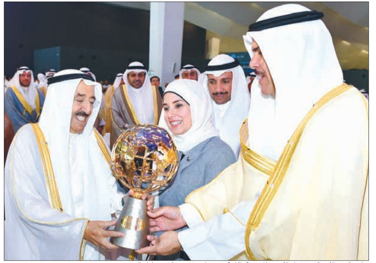
صاحب السمو الأمير الشيخ صباح الأحمد يتلقى هدية تذكارية من دجنان بوشهري والشيخ سلمان الحمد