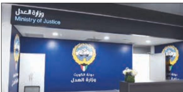
مكتب لتقديم خدمات وزارة العدل داخل المبنى