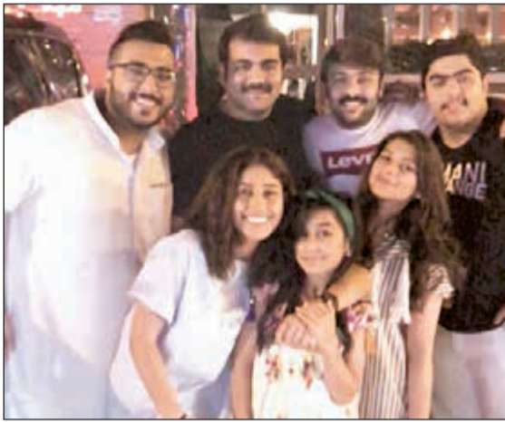
.. مع بعض من نجوم المسرحية