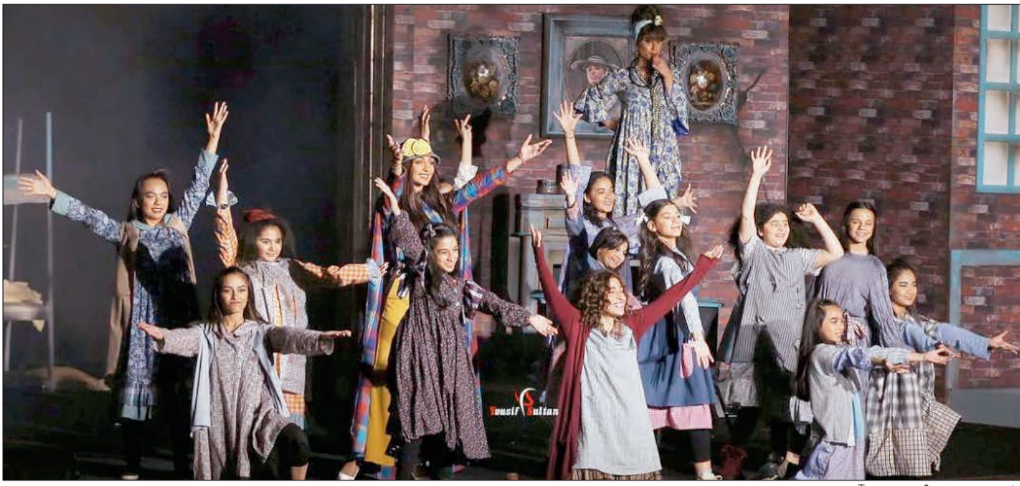
مشهد من مسرحية «Tomorrow»