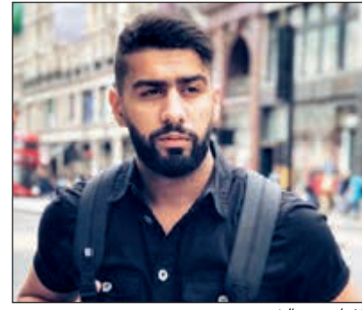
الفنان بدر الشعبي