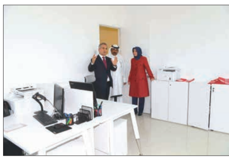
جولة في المركز (محمد ماشم)

قالت وزيرة الشؤون ووزيرة الدولة للشؤون الاقتصادية هند الصباح إن وزارة الشؤون الاقتصادية تظهر أمس أن الوزارة تعمل على التحديد بشكل استثنائي للمستفيدين من بند العجز المالي لحدن صدور التشريع، لافتة إلى أن فترة الصيف هذه فترة جيدة لجمع جميع التعديلات وإخراجها بتشريع متكامل بما يتوافق مع مطالبات النواب. وعن المشاريع التنموية التابعة لوزارة الشؤون وتأخرها بسبب الإعتمادات المالية، قالت إننا وصلنا إلى 90٪ بتفويض هذه المشاريع، وهذه نسبة عالية مقارنة بالجهات الأخرى، وبموجبها نعمل على تذليل الصعوبات على أي مشروع متعثر على مستوى كل