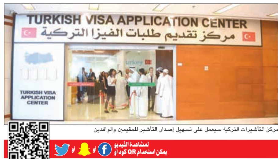
مركز التأشيرات التركية سيعمل على تسهيل إصدار التأشيرات للمقيمين والوافدين

الرئيس أردوغان وصاحب السمو الأمير الشيخ صباح الأحمد والتي وصلت إلى 5 زيارات في عام 2017، مدى قوة ومثانة هذه العلاقات وتم على خلفيتها إنشاء آليات للمتابعة مثل لجنة التعاون المشترك. وأوضحت أن العلاقات الاقتصادية والتجارية بين البلدين قد حققت تقدما كبيرا في السنوات الأخيرة حيث وصل حجم التبادل التجاري في عام 2017 إلى 1,3 مليار دولار إلا أن هذا المبلغ لا يزال لا يرقى لمستوى الطموح بالمقارنة بمستوى العلاقات السياسية، مبيحة أن الماقلين الأتراك يتغفون مشروعات ضخمة في البنية التحتية في الكويت. وكشفت أن 255 ألف سائح كويتي زاروا تركيا العام الماضي، معربة عن أملها في أن يصل العدد إلى 300 ألف هذا العام. وأشارت إلى أن تركيا حققت نموا وتطورا ملحوظا بقيادة الرئيس أردوغان وهذا ما نشعر به واقعا ملموسا، كما قامت الحكومة التركية بتسهيل إجراءات الحصول على التأشيرة من خلال التأشيرة الإلكترونية ومركز الاتصال القنصلي الذي يعمل على مدار الساعة طوال أيام الأسبوع، كما كان للمناقل الوطني الخطوط التركية والخطوط الجوية الكويتية الأثر الكبير في تعزيز العلاقات الخائفة وزيادة عدد السائحين، مبيحة أنه من أجل تسهيل سفر الكويتيين تم رفع التأشيرة عنهم، وحرصا على تسهيل إصدار التأشيرات للمقيمين وغير محددى الجنسية قررنا الاستعانة بشركة وسبطة ونحن على يقين أنها ستقدم أفضل الخدمات لتسهيل مهمة الراغبين في الحصول على تأشيرة، متوجهة بالشكر لشركة جيت واي والعاملين في السفارة من القسم القنصلي.