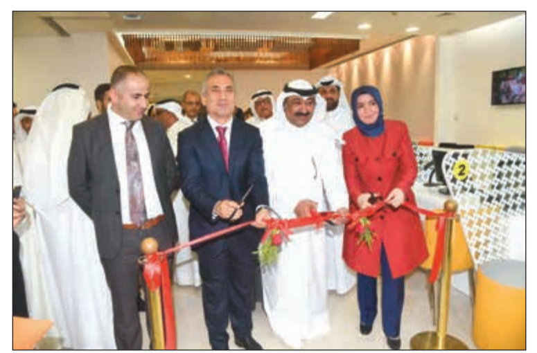
السفير وليد الخبيزي والسفيرة عائشة كويتاكا يفتتحان مركز تقديم الطلبات للتأشيرات التركية