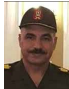
اللواء محسن عبدالنبي

القاهرة - وكالات: أصدر الرئيس عبدالفتاح السيسي قراراً جمهورياً بتعيين اللواء محسن محمود علي عبدالنبي، مدير إدارة الشؤون المعنوية السابق، مديراً لمكتب رئيس الجمهورية. وتخرج اللواء محسن عبد النبي في الكلية الحربية عام 1978، دفعة 71 حربية، حيث تولى جميع الوظائف القيادية في سلاحه، حتى تم تعيينه في منصب نائب