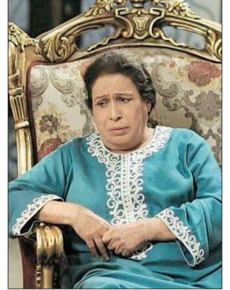
الفنانة القديرة حياة الفهد

لتؤكد من خلالها مدى إنسانيتها وطيبة قلبها، حيث تناسلت الفهد أي خلاف سابق جمعها مع طارق العلي وقامت بالمبادرة بالدعاء لابنه، طارق الذي حظي بإشادة وإعجاب اغلب رواد مواقع التواصل الاجتماعي سواء من الفنانين أو من الجمهور. وكان الفنان طارق العلي سبق أن ذكر أن الفنانة القديرة حياة الفهد ستبقى على رأسه ورأس أي من زملائه الفنانين كونها فنانة قديرة ولها مكانة في قلبه وقلب أهل الكويت والخليج من خلال كلمة وجهها طارق العلي بعد حصوله على جائزة أفضل عمل كوميدي بمهرجان تكريم أهل الفن والإعلام، وذلك عن دوره في مسلسل «واحد مهم» ومبادرة الفهد تؤكد روح المحبة والتسامح.