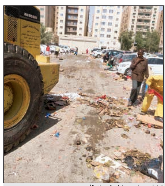
الباغة هربوا بعد مشاهدة رجال الأمن

المزاد بالجمارك على تقييم البضائع من جهة السعر بشكل تقريبي قبل تنظيم المزاد حفاظاً على المال العام.