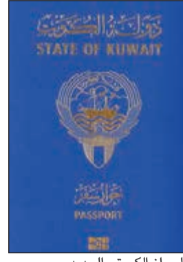
الجواز الكويتي الجديد