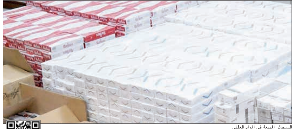
السجاير المبيعة في المزاد العلني

أعلن رئيس لجنة بيع المزاد العلني في الإدارة العامة للجمارك علي العززي عن تنظيم مزاد علني، بمقر «بيت المال» في منطقة الصليبية، الأسبوع الماضي جرى خلاله بيع «5270» كروان سجاير مقابل (36500) دينار.