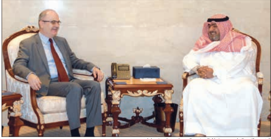
الشيخ ثامر العلي مستقبلا السفير الروماني دانيل تاناسي

التعاون المشترك وبحث العلاقات الثنائية التي تجمع البلدين الصديقين وسبل تعزيزها وتطويرها. وأضاف انه تم بحث اهم القضايا المشتركة التي تهم البلدين على الساحتين الإقليمية والدولية.