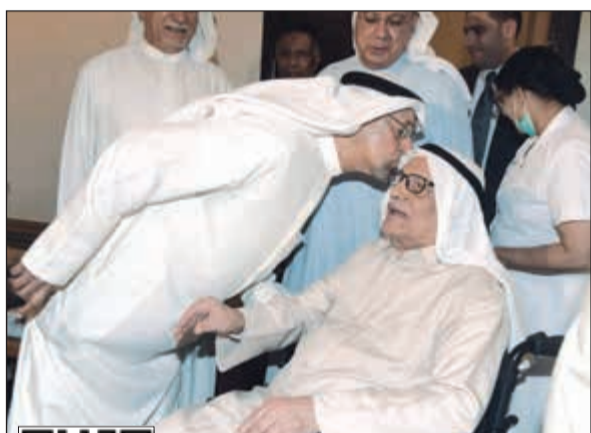
قبلة على رأس العجيري