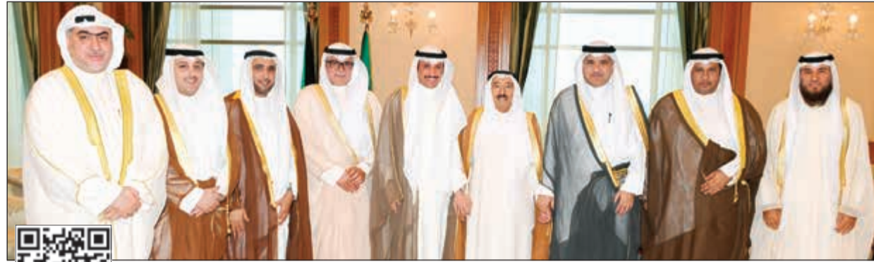
صاحب السمو الأمير الشيخ صباح الأحمد مستقبلاً رئيس مجلس الأمة مرزوق الغانم وأعضاء مكتب المجلس وعلام الكندري ووفد لجنة الشؤون التشريعية والقانونية الذي زار فرنسا

يتفضل صاحب السمو الأمير الشيخ صباح الأحمد فيشمل برعايته وحضوره حفل افتتاح مدينة الجهراء الطبية، وذلك في تمام الساعة العاشرة والنصف من صباح اليوم. إلى ذلك، استقبل صاحب السمو الأمير الشيخ صباح الأحمد بقصر السيف صباح أمس رئيس مجلس الأمة مرزوق الغانم وأعضاء مكتب المجلس لدور الانعقاد العادي الثاني للجلسة التشريعية الخامسة عشر وأمين عام مجلس الأمة علام الكندري ووفد لجنة الشؤون التشريعية والقانونية بالمجلس الذين قاموا بزيارة رسمية إلى جمهورية فرنسا. كما استقبل سمو الأمير بقصر السيف ظهر أمس نائب رئيس مجلس الوزراء ووزير الداخلية الشيخ خالد الجراح، حيث قدم لسموه الفريق عصام النهام، وذلك بمناسبة تعيينه وكيلاً لوزارة الداخلية.