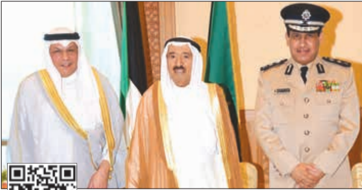
صاحب السمو الأمير الشيخ صباح الأحمد مستقبلاً الشيخ خالد الجراح والفريق عصام النهام