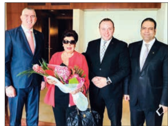
ترحيب بالفنانة الشهيرة رجاء الجداوي

شاطئ المسلة أجواء في غاية الدفء والألفة، ولطالما كان الفندق ملاذا للعديد من الشخصيات الشهيرة منذ افتتاحه، ويواصل اليوم تقديم المستوى الرفيع ذاته من الضيافة ليرتقي بتطلعات ضيوفه نحو آفاق جديدة. ويقع فندق ومنتجج جميرا شاطئ المسلة على مسافة عشر دقائق فقط من مطار الكويت الدولي وبالقرى من مركز المال والأعمال وكبرى مراكز التسوق بالعاصمة الكويتية، ويتألف