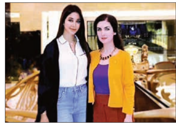
الفنانة أسيل عمران في «جميرا»