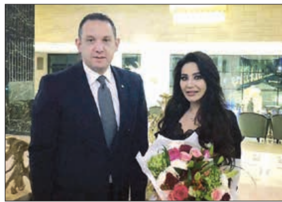
..وترحيب بالإعلامية لجن عمران

الذين زاروا الكويت، بمن في ذلك الملحن اللبناني ميشيل فاضل والإعلامية السعودية لجن عمران وشقيقتها الممثلة أسيل عمران، والمنتج الموسيقي اللبناني هادي شرارة والممثلة المصرية الشهيرة رجاء الجداوي وغيرهم الكثير. وحظى المشاهير الضيوف بحفاوة بالغة وترحيب لائق من قبل فريق الفندق عقب وصولهم انسجاما مع شعاره اختلافًا متميزًا، والذي يضمن لتزلاء فندق ومنتجج جميرا