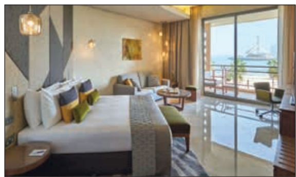
إقامة فاخرة في غرف عصرية