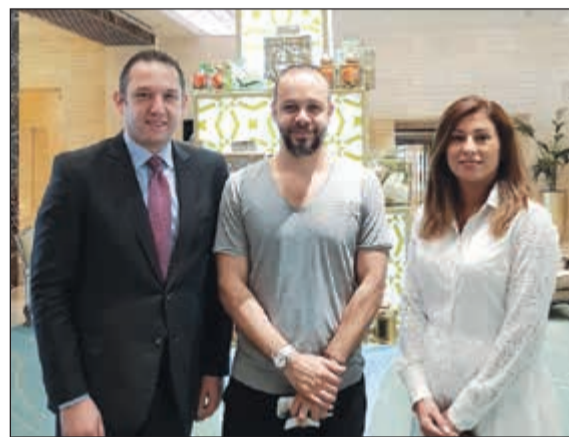
استقبال الملحن اللبناني ميشيل فاضل