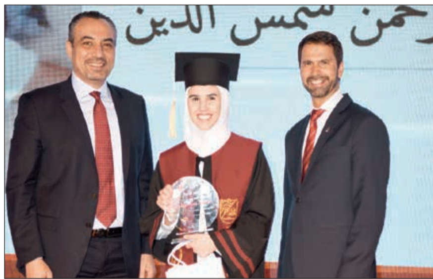
تسليم الشهادات للخريجين

والمستشفيات والصيدليات في الكويت. كما أن مجموعة «صيدليات المطوع» تضم أكثر من 25 صيدلية موزعة في جميع محافظات الكويت مكونة من فريق من الصيادلة المتخصصين والمتأخرين على مدار الساعة للرد على أي سؤال عن علاج أو دواء أو للاستفسارات المتعلقة بالخدمات التي تقدمها الصيدليات، وما يميز «صيدليات المطوع» عن غيرها شراكتها مع الجمعيات التعاونية التي وصل عدد الفروع فيها إلى 15 فرعاً يقدم خدمات عالية المستوى للعديد من المناطق السكنية لتسهيل وصول المستهلكين إليها وتلبية احتياجاتهم بسرعة، وهناك سبع صيدليات من المجموعة تعمل على مدار 24 ساعة لمدة 7 أيام. ويعتبر قطاع الأدوية والمعدات الطبية في شركة علي عبد الوهاب المطوع التجارية إحدى الشركات الرائدة في مجال الاستيراد والتوزيع بالكويت، من القطاعات المميزة جدا والوكيل المعتمد لشركات عالمية مثل «روش»، و«تاكيدا»، و«أمجين»، و«سانوفي»، وأول موزع لمنتجات العناية بالبشرة والشعر للكثير من الشركات مثل «بايوديرما»، و«نوكس»، إضافة إلى المعدات والمستلزمات الطبية من شركات رائدة مثل «بيوترونك»، و«مافج»، و«شولكا»، وغيرها، كما وأن قسم الأدوية والأجهزة والمعدات