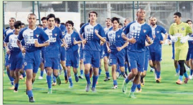
الجدية والحماس حاضرا في تدريبات أزرق الشباب

وشارك في التدريبات عدد كبير من اللاعبين وهم ضمن قائمة الـ 63 لاعبا الذين وقع الاختيار الأولي عليهم من قبل الجهاز الفني، حيث تغيب عدد منهم بداعي أداء اختبارات التأهيلية العامة أو السفر. ومن جهة، عبر المدرب السلطان عن أسفه على المغالبة بالإقبال الكبير للاعبين على التدريبات وقال لـ «الأنباء» هذه