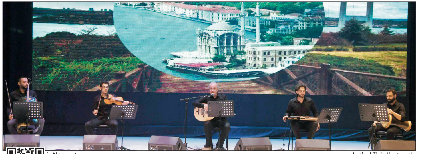
جانب من حفل فرقة إسطنبول