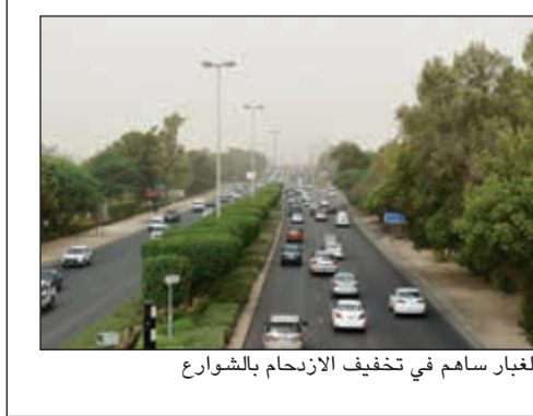
الغبار ساهم في تخفيف الازدحام بالشوارع