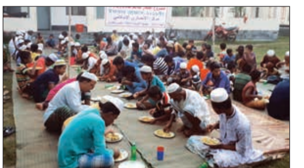
جانب من موائد الإفطار الرمضانية التي نظمها «النجا» في الخارج