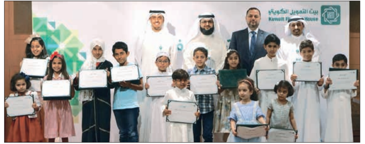
مسؤولو «بيتك» مع الفائزين والفائزات بمسابقة «قارئ الشهر» الرمضانية في لقطة جماعية

التي تركز على التنمية المجتمعية التي هي ركيزة النجاح والنمو الاقتصادي. وتأتي هذه المسابقة ضمن إطار برنامج «بيتك» الحافل في شهر رمضان «بيتك» الذي شمل أنشطة ومساهمات إنسانية واجتماعية متعددة، ومبادرات توعوية وتواصل يومي مع الجمهور، تأكيداً على حرص البنك على الالتزام برسالة التجاري الإنسانية بما يؤكد مفهوم المسؤولية الاجتماعية، والى الأهداف التنموية المستدامة.