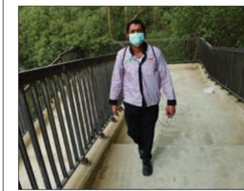
الكمام للحماية من مخاطر الغبار