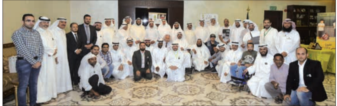
صورة جماعية للمكرمين وبيدو رئيس جمعية الإصلاح الاجتماعي ورئيس مجلس إدارة «نماء» للزكاة والتنمية المجتمعية

حريصون على خدمة تلك الفئات المحتاجة فإننا أيضاً حريصون على التثبّت من أحقية تلك الحالات للمساعدة لأننا نؤمن على أموال المتبرعين وكلاء عنهم لوضع تبرعاتهم في مكانها الصحيح المستحقها. واختتم الزيد كلمته قائلاً إن «نماء» تستهدف في الأيام القليلة المقبلة حملة خيرية جديدة مخصصة لدفع الرسوم الدراسية لطالب المدارس، خاصة وأن هذه الحملة ستنتظم قبل بداية العام الدراسي المقبل، آمين أن تكون لكم مساهماتكم الخيرية في هذا المجال.