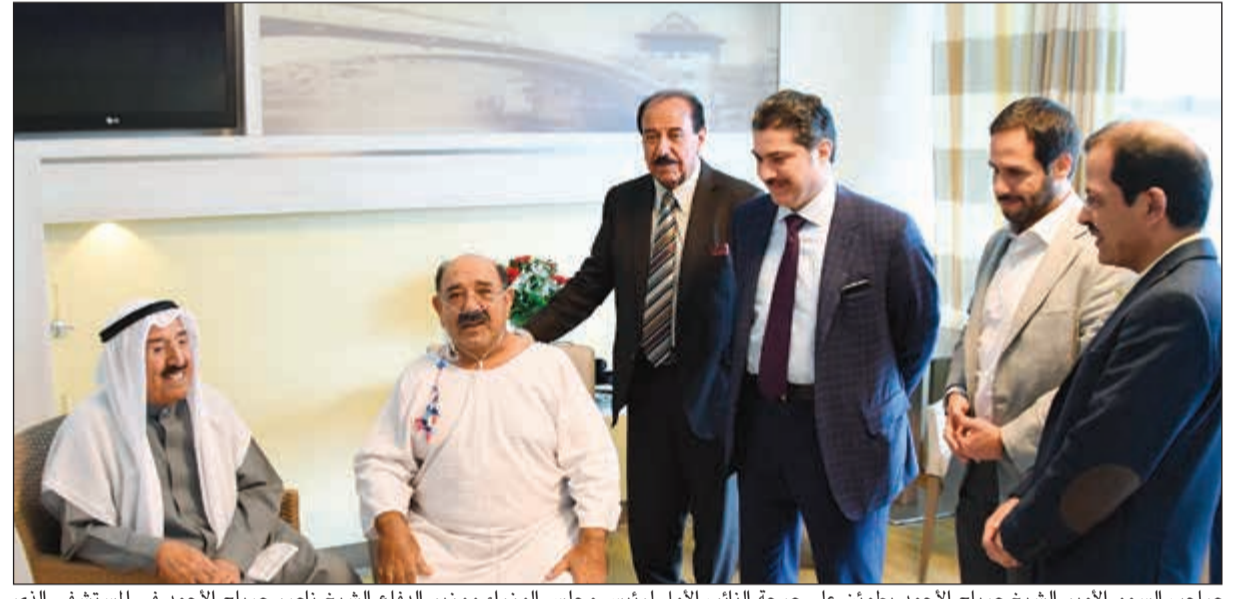
صاحب السمو الأمير الشيخ صباح الأحمد يطمئن على صحة النائب الأول لرئيس مجلس الوزراء ووزير الدفاع الشيخ ناصر صباح الأحمد في المستشفى الذي يعالج فيه بألمانيا بحضور الشيخ مبارك جابر الأحمد والشيخ خالد العبدالله والشيخ عبدالله الناصر

«كونا» و«واس»: بعث خادم الحرمين الشريفين الملك سلمان بن عبدالعزيز آل سعود، برفقة تهنئة إلى صاحب السمو الأمير الشيخ صباح الأحمد، بمناسبة نجاح العملية الجراحية التي أجريت للنائب الأول لرئيس مجلس الوزراء ووزير الدفاع الشيخ ناصر صباح الأحمد، جاء فيها: يسرنا بمناسبة نجاح العملية الجراحية التي أجريت للشيخ ناصر صباح الأحمد، أن نبعث لكم أجمل التهاني، وأطيب التمنيات، سائلين الله العليّ القدير أن يمتعته بالصحة والعافية، وأن يحفظكم من كل سوء ومكروه، إنه سميع مجيب. كما بعث ولي عهد المملكة نائب رئيس مجلس الوزراء وزير الدفاع صاحب السمو الملكي الأمير محمد بن سلمان، برفقة تهنئة إلى صاحب السمو الأمير الشيخ صباح الأحمد، بهذه المناسبة قال فيها: «يسرنا بمناسبة نجاح العملية الجراحية التي أجريت للشيخ ناصر صباح الأحمد، أن