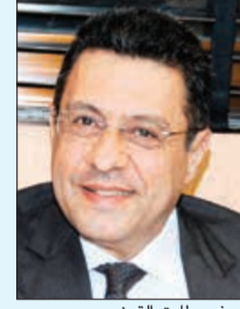
السفير طارق القوني

عبدواوي برفقة تهنئة للنائب الأول لرئيس مجلس الوزراء ووزير الدفاع الشيخ ناصر صباح الأحمد بمناسبة نجاح العملية الجراحية، وقال