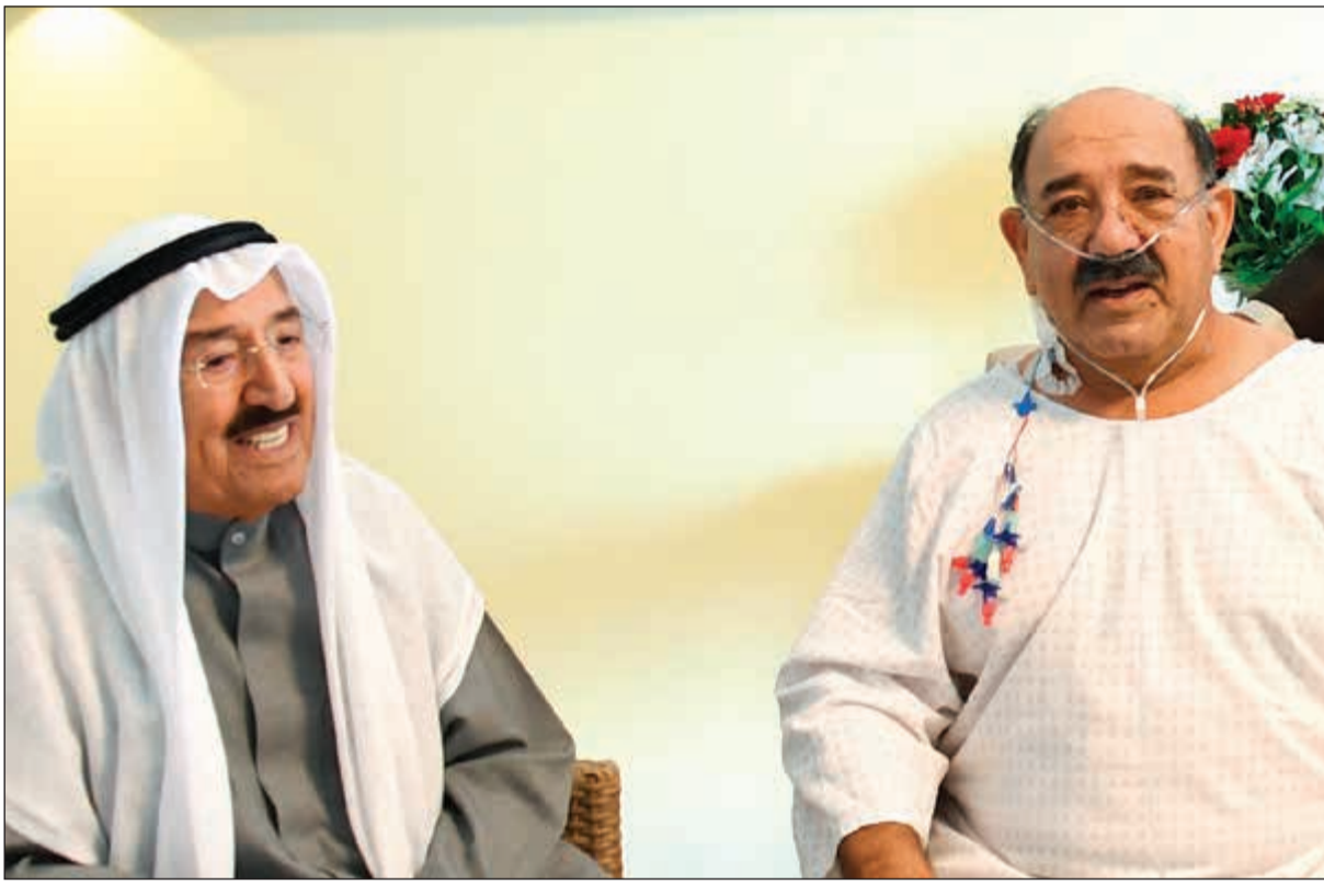
صاحب السمو الأمير الشيخ صباح الأحمد والشيخ ناصر صباح الأحمد