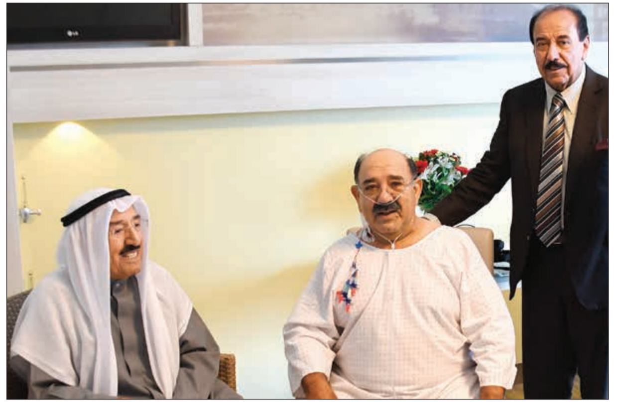
صاحب السمو الأمير الشيخ صباح الأحمد لدى زيارة الشيخ ناصر صباح الأحمد بالمستشفى في ألمانيا ويبدو الشيخ مبارك جابر الأحمد