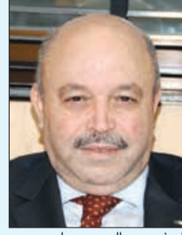
السفير عبد الحميد عبداري

هذا السفير المصري طارق القوني النائب الأول لرئيس مجلس الوزراء ووزير الدفاع الشيخ ناصر صباح الأحمد بمناسبة نجاح العملية الجراحية، وجاء في بيان من السفارة المصرية: تتقدم سفارة جمهورية مصر العربية بالكويت الشقيقة باسم الجالية المصرية في الكويت، بخالص التهاني إلى النائب الأول لرئيس مجلس الوزراء ووزير الدفاع الشيخ ناصر صباح الأحمد بعد نجاح العملية الجراحية التي أجريت له في ألمانيا، متمنين له دوام الصحة والعافية، ونسأل المولى عز وجل أن