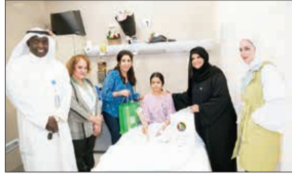
«التجاري» يسعى دوما لرسم البسمة على وجوه المرضى