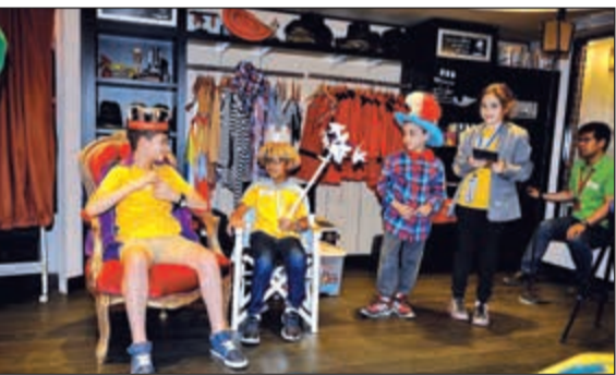
مجموعة من الأطفال في «كيدزانيا»