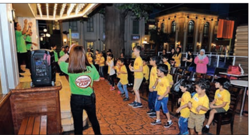
أنشطة مختلفة للأطفال في «كيدزانيا»

يعود المرح من جديد في «كيدزانيا» مع أنشطة المخيم الصيفي الرائعة التي بدأت من 24 يونيو، حيث سيتمكن الأطفال الذين يقضون إجازة الصيف في الكويت من الاستمتاع بمجموعة من الأنشطة وورش العمل الترفيهية والتفاعلية في المدينة، ضمن أجواء مسلية تقيهم من حر الصيف. ويوفر برنامج المخيم الصيفي الذي طال ترقبه أكثر من 20 ورشة عمل تعليمية وترفيهية للأطفال على مدى فترة الصيف، ويمكن للزوار الاختيار من بين العديد من البرامج التي يوفرها البرنامج ابتداء من بطاقة اليوم الواحد، أو الأسبوع أو الأسبوعين أو الثلاثة أسابيع، والتي تغطي مختلف الفئات العمرية والهوايات المختلفة لدى الأطفال، من التحديات البدنية، والاختبارات العلمية، والاكتشافات الجيولوجية، وصفوف الطهي، وورش الأزياء وتصميم الإكسسوارات، والألغاز وألعاب الذكاء. ويمكن للأطفال الصغار من 2-4 سنوات أيضا الانضمام