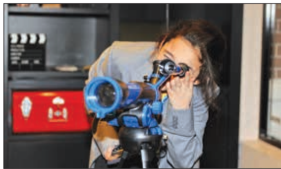
ممارسة الهوايات المحببة للاطفال

عبر مواقف حياتية متنوعة كالوصول إلى المطار أو زيارة وسط المدينة واستكشاف شوارعها. نقدم للأطفال نسخة من العالم الواقعي في بيئة آمنة ومدينة تتمتع بالإكتفاء الذاتي وكما في الحياة الواقعية، يمكن للأطفال الاختيار من بين المهن والأعمال الحقيقية كالشرطي أو الطبيب أو الصحافي أو التاجر، ليتمكنوا من كسب الأموال بعملة «كيدزوز» التي بوسعهم ادخارها أو إنفاقها.