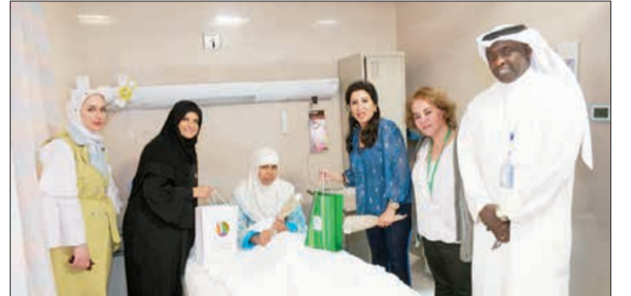
الورد خلال زيارة إحدى المريضات بالمستشفى

في إطار الترتيبات التي يقوم بها البنك التجاري الكويتي لتقديم الدعم والمساندة والرعاية للعديد من الأنشطة الاجتماعية والإنسانية التي تنظمها محافظات الكويت لخدمة أفراد المجتمع، ومنها محافظة حولي، واحتفالاً بعيد الفطر،