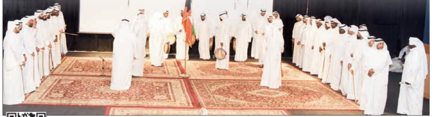
جانب من عرض فرقة الزايد للفنون الشعبية