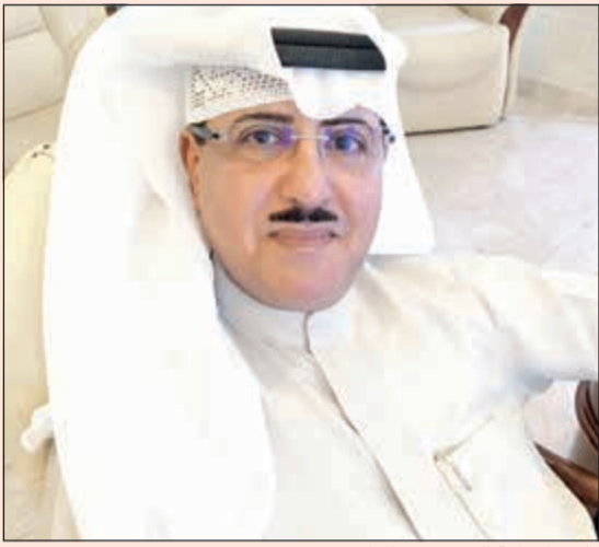
وكيل الإذاعة الشيخ فهد المبارك

بتوجيهات من الوكيل المساعد لشؤون قطاع الإذاعة بوزارة الإعلام الشيخ فهد المبارك، استضاف البرنامج النوع «أحلى صباح»، الذي يبث من الأحد حتى الخميس عبر أثر محطة كويت Fm، فرقة الأخوة البحرينية التي تزور البلاد خلال هذه الأيام بدعوة من المجلس الوطني للثقافة والفنون والآداب للمشاركة في مهرجان الموسيقى الدولي بدورته الجديدة والتي تنتهي 28 الجاري.