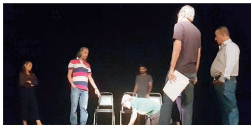
جانب من بروقات مسرحية «منزل فوق غيمة»

الاجتماعية التي نعيشها حالياً. وحول الجديد الذي يسعى لتحقيقه من خلال العرض المسرحي أكد ان العمل مختلف كلياً ومغاير عما قدمه في السابق، حيث استحضر المسرح الفرنسي عندما يناقش قضية اجتماعية فوق خشباته، وقال: أتمنى نجاح الرؤية الإخراجية الجديدة لهذا العمل الذي سميت من خلاله إلى مدى أجيال مختلفة حتى يستفيد الجميع من بعضهم البعض. وبخصوص عنوان المسرحية الفلسفي، قال انه يتماشى مع أحداث العرض، مؤكداً ان المنطلق لا يجد أي صعوبة في فهم العنوان من خلال الأحداث التي تجري أمامه