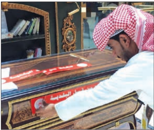
إغلاق أحد المحلات المخالفة

قامت بلدية الأحمدية صباح أمس بحملة ميدانية أسفرت عن إغلاق 5 محلات تجارية مخالفة قوانين وأنظمة البلدية في إحدى المجمعات التجارية بالمحافظة. كما قامت النوبة ج بقسم إزالة المخالفات بتحرير 9 مخالفات إعلان وإزالة 30 إعلاناً عشوائياً من شوارع المحافظة الرئيسية. من جهة أخرى، قامت إدارة السلامة بالأحمدية بجولة تفقدية على المشاريع الإنشائية قيد الإنشاء للتأكد من تراخيص التشوينات ومدى الالتزام بقواعد وأنظمة السلامة.